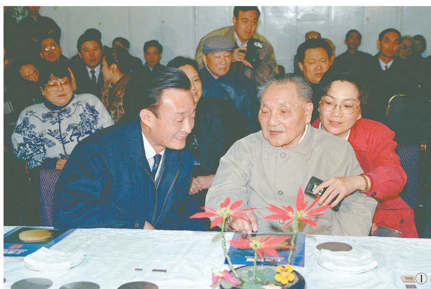
图①：1992年2月10日，邓小平同志在上海贝岭微电子制造有限公司参观时与吴邦国同志交谈。