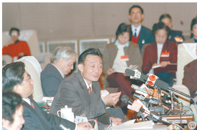
图⑤：1994年3月，时任上海市委书记的吴邦国同志在全国两会上海代表团全会上。

吴邦国同志是中国特色社会主义民主法治建设的重要领导者。他强调，如果没有比较完备的、高质量的法律法规，就谈不上实现社会主义民主政治的制度化、规范化和程序化，就谈不上依法治国、建设社会主义法治国家。在党中央领导下，他将立法工作作为全国人大及其常委会的首要任务，紧紧围绕党中央确定的立法工作目标，坚持科学立法、民主立法，适应社会主义市场经济发展、社会全面进步和加入世贸组织的新形势，把中国特色社会主义法律体系中基本的、急需的、条件成熟的法律作为立法重点，抓紧制定修改相关法律，集中开展法律清理工作。2003年3月，他担任中央宪法修改小组组长，在中央政治局常委会领导下主持宪法修改工作。由十届全国人大二次会议通过的宪法修正案，确立了“三个代表”重要思想在国家政治和社会生活中的指导地位，明确国家尊重和保障人权、依法保护公民的私有财产权和继承权等内容，对促进我国经济社会发展、推进中国特色社会主义民主法治建设具有重要意义。在他的主持下，第十届、十一届全国人大及其常委会共审议通过宪法修正案草案、法律草案、法律解释草案和有关法律问题的决定草案186件，包括物权法、企业破产法、企业所得税法、公务员法、行政许可法、治安管理处罚法、劳动合同法、未成年人保护法、妇女权益保障法、关于加强网络信息保护的決定等。在党中央领导下，他主持制定反分裂国家法，把党和国家对台工作的大政方针和政策措施以法律形式固定下来，为反对和遏制“台独”分裂活动、促进祖国和平统一提供有力法律保障。他主持对香港特别行政区基本法、澳门特别行政区基本法及其附件有关条款作出解释并通过相关决定，推动两个基本法正确实施和“一国两制”方针贯彻落实。他主持制定修改一系列对中国特色社会主义事业发展具有重大影响的法律，为推动形成中国特色社会主义法律体系作出重要贡献。（下转第四版）