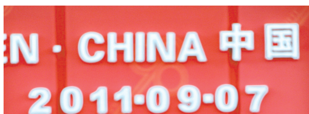
图⑧：二〇一一年三月十日，十一届全国人大二次全体会议在北京人民大会堂举行第二次全体会议。吴邦国同志作全国人民代表大会常务委员工作报告。