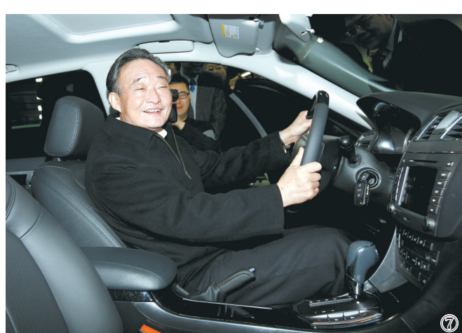
图⑦：2010年1月30日，吴邦国同志在上海汽车集团股份有限公司技术中心察看新能源样车。