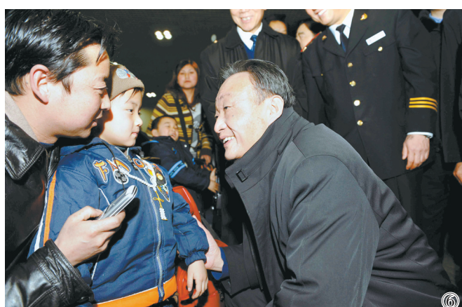
图⑥：2008年2月3日，吴邦国同志在北京西站候车室与旅客交谈。