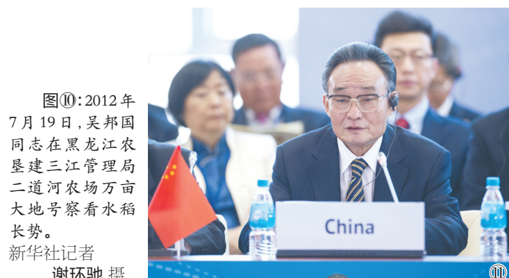
图⑩：2012年7月19日，吴邦国同志在黑龙江农垦三江管理局二道河农场万亩大地号察看水稻长势。