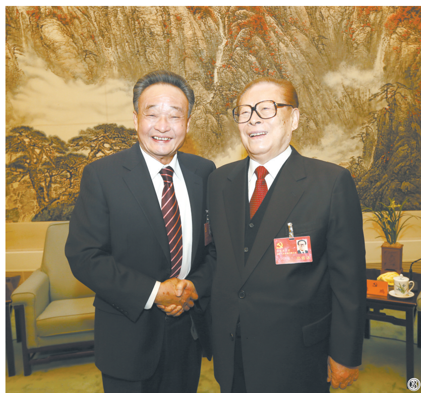
图③：2012年11月14日，中国共产党第十八次全国代表大会在北京闭幕。这是闭幕会前，江泽民同志与吴邦国同志在一起。