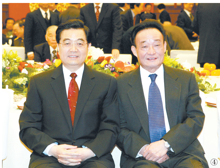
图④：二〇〇五年一月一日，全国政协在北京举行新年茶话会。这是胡锦涛同志与吴邦国同志在一起。