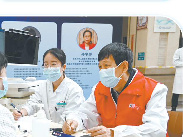
① 大型义诊现场。 ② 进行手术模拟。 ③ 教学查房病例讨论。 ④ 为患者提供诊疗意见。