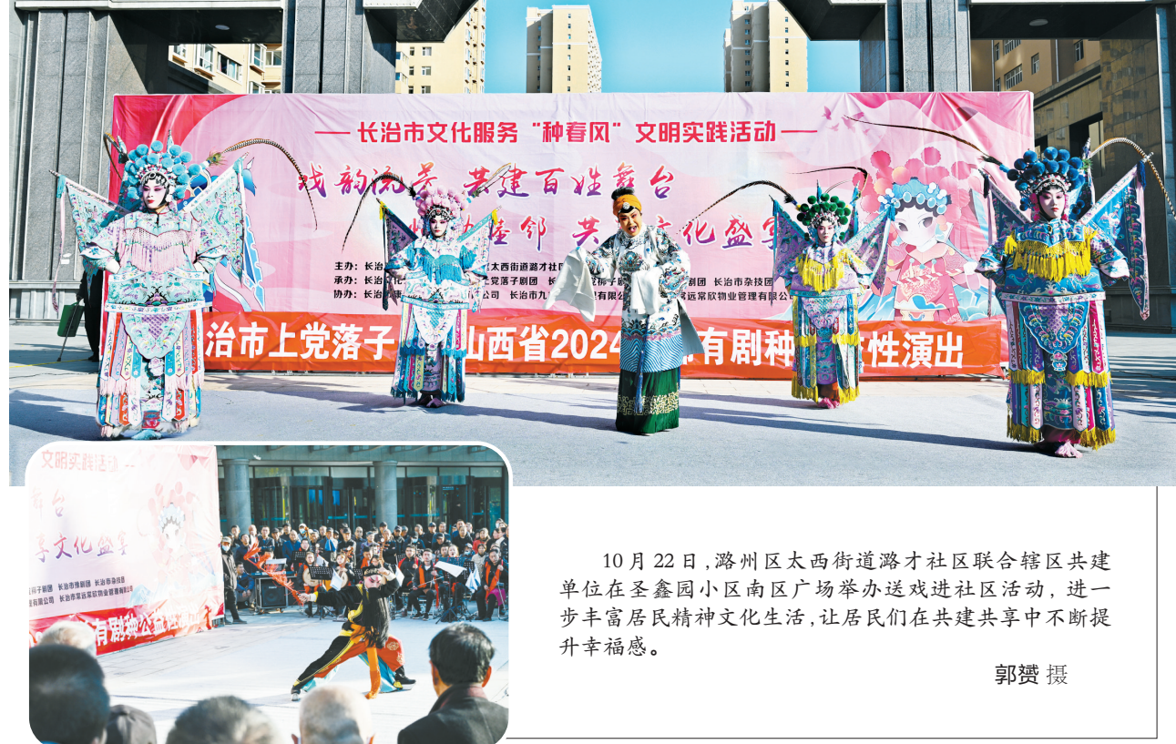
10月22日,潞州区大西街潞才社区联合辖区共建单位在圣鑫园小区南区广场举办送戏进社区活动,进一步丰富居民精神文化生活,让居民们在共建共享中不断提升幸福感。

从天地生养到规模发展,从集散市场销售到“中药材+”新业态……在沁源,小药材种出了兴县富民“千金方”,中药材产业成为撬动区域经济发展的新支点。