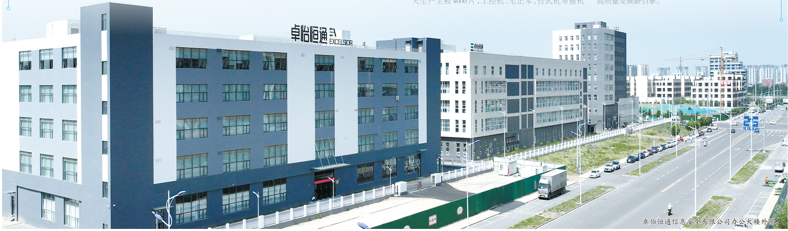
卓怡恒通信息安全有限公司办公大楼外景。