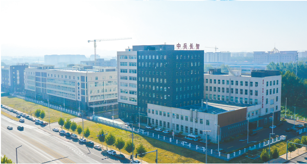
中兵科技与龙芯科技产业园。

中兵长智科技有限责任公司是中国兵器工业集团信创产品的科研及生产基地,具备信创计算机研发生产运维能力、行业应用方案解决能力、北斗应用方案解决能力、检验试验服务能力及信息系统集成服务能力。