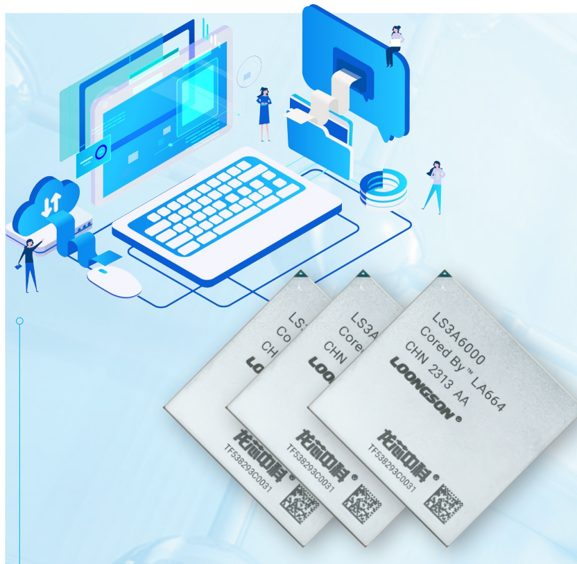
龙芯中科自主研发的LS3A6000芯片。