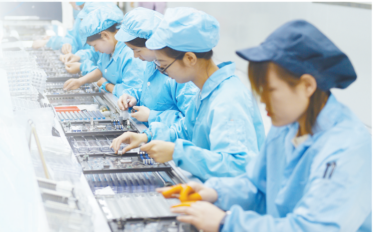
卓怡恒通一线工人正在DIP生产线上作业。

金秋十月,项目建设加力提速,产业发展活力澎湃,科技研发攻坚向新……走进长治高新区龙芯(长治)信创产业园,处处展现出数字经济发展的勃勃生机。