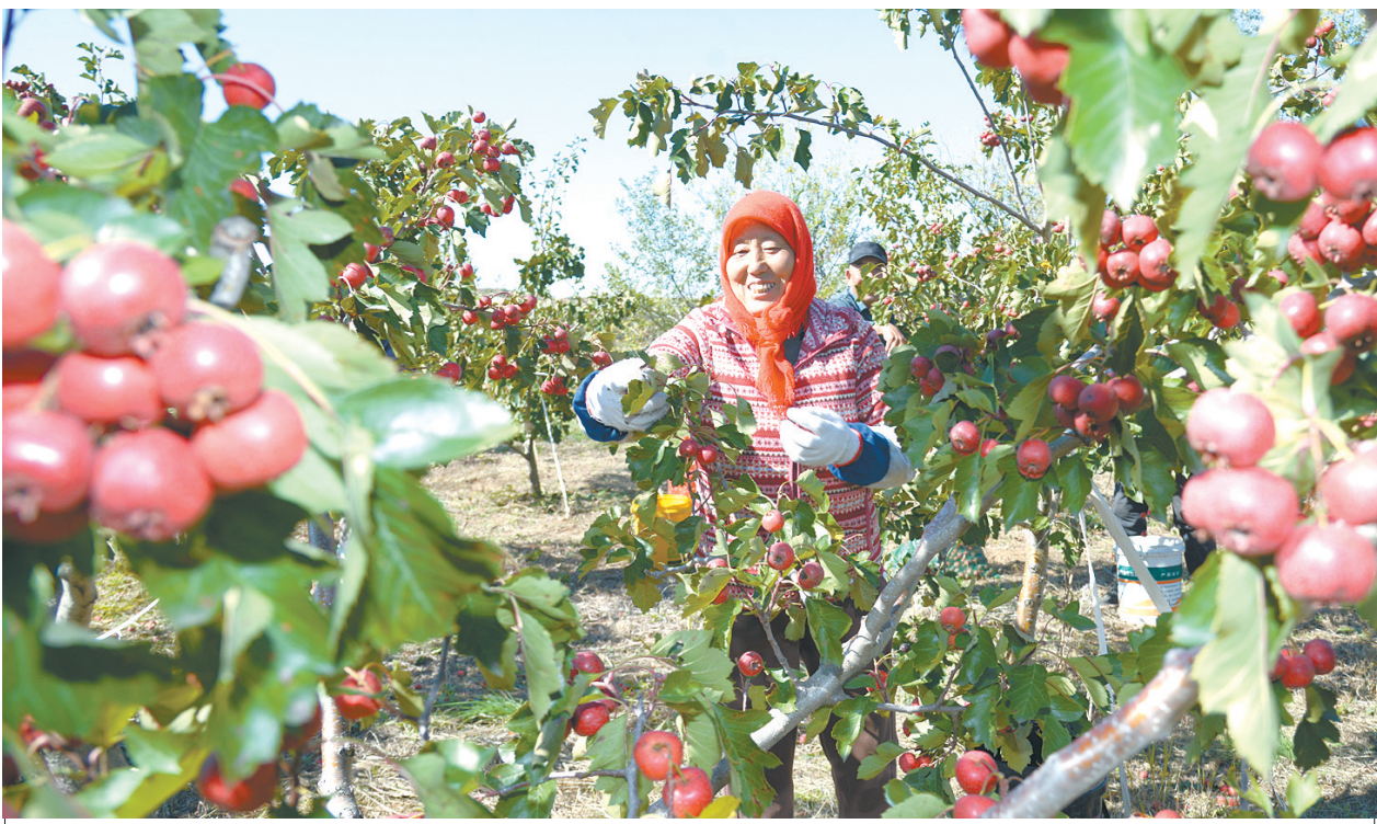
金秋时节,上党区东和乡南和村山种植基地里,果农们在采摘山楂。近年来,该村依托“基地+农户”的经营模式,通过流转土地,大力发展特色林果业种植,有力带动当地群众就业增收。

在襄垣县城乡供水有限公司智慧水务调度中心,硕大的电子显示屏展示了另一种“管水”方式:只需在控制台轻点鼠标,管段运行情况、供水量、水压等实时