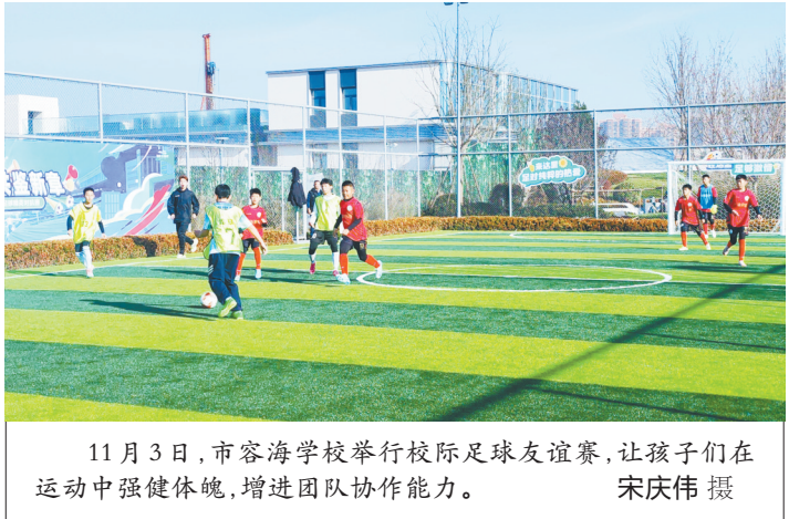
11月3日,市容海学校举行校际足球友谊赛,让孩子们在运动中强健体魄,增进团队协作能力。

本报讯 为满足广大人民群众多样化需求,提供好“家门口”的贴心便民服务,打通关心群众、服务群众的“最后一公里”,11月3日,襄垣县在文庙广场举办以“文明实践在身边 志愿服务暖人心”为主题的文明集市活动。 文明集市现场,健康义诊、手机贴膜、便民理发等18个与生活息息相关的志愿服务项目集中“摆摊”,丰富多彩的志愿服务活动赢得群众称赞。除此之外,文明集市还设置多样化的“移动课堂”,开展道德宣传、反诈宣传、心理咨询、环保宣传、禁毒宣传等。志愿者们为过往群众发放宣传资料、科普各类知识、提供免费咨询,丰富群众的精神文化生活,提升科学文化素养。 群众在哪里,文明实践就延伸到哪里。近年来,襄垣县充分发挥新时代文明实践中心(所、站)的阵地作用,通过整合各类资源、凝聚各方力量,常态化开展文明集市文明实践活动,持续为群众搭建更多交流互动平台,真正让“小集市”更好地服务“大民生”,真正把实事办到群众心坎上。 (韩聖玉)