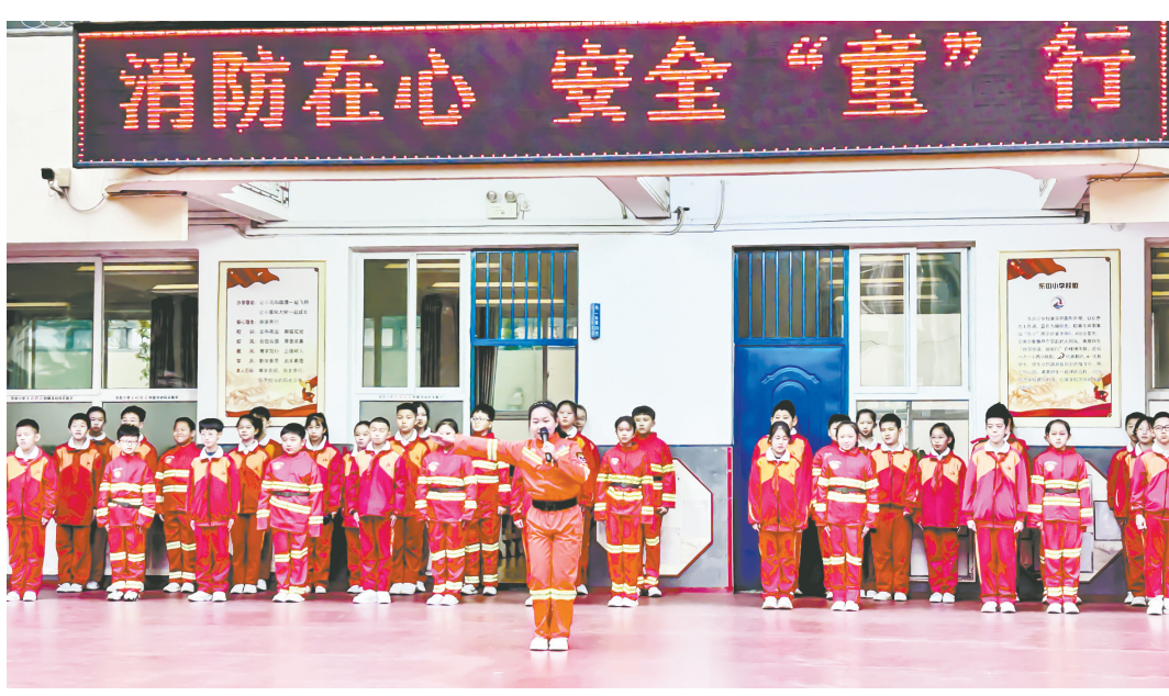
11月8日，潞州区东街小学开展“全民消防 生命至上”系列主题教育活动，将消防安全教育落在实处。图为该校举行“消防在心 安全童行”主题升旗仪式。