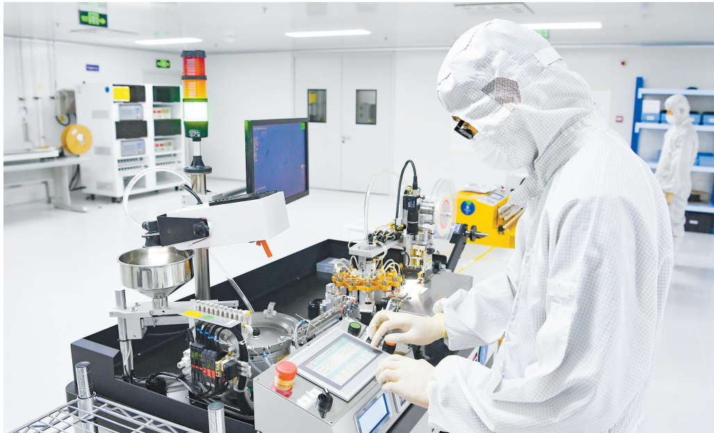
近日,山西中科路安紫外光电科技有限公司生产车间内,员工在检测产品。该公司是一家深紫外LED高新技术企业,生产的产品广泛应用于公共卫生安全和母婴、家居等智能化民用卫生健康领域。

找“路子”,破解“发挥作用难”。强化组织引领作用,实行“双帮”计划,做到双向赋能,根据流动党员在信息渠道多、资源联系广等方面的优势,依托重要节假日,流动党员集中返乡契机,举办流动党员座谈会、开展“老乡反哺家乡”活动,邀请流动党员中的能人分享创业致富经,为黎城县的发展与建设添砖加瓦。结合村党组织带头人培育储备三年行动,鼓励流动党员主动担起“建设他乡、回报家乡”责任,为家乡发展建言献策,成为助推乡村振兴的“活力因子”。