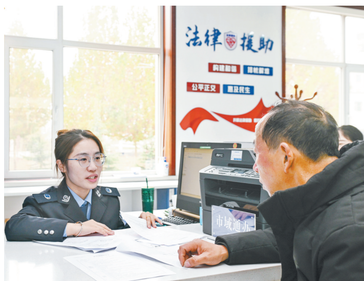
11月15日，潞州区司法局司法工作人员在为市民发放法律服务联系卡。近年来，该局聚焦群众急难愁盼，以务实暖心的司法服务，不断提升法律援助工作质效。

2009年至今，15年的时间里，花样跳绳在平顺县实验小学实现了从无到有，从重点培养到全面普及，先后承办了“山西省学生跳绳联赛”“长治市学生跳绳联赛暨全县学生花样跳绳比赛”。跳绳队还代表全省参加了在中央一台播出的“挑战不