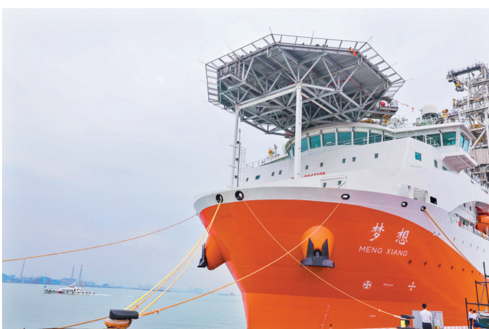
11月17日拍摄的靠泊在广州海洋地质调查局科考码头的大洋钻探船“梦想”号。当日,拥有最大11000米的钻深能力、我国自主设计建造的首艘大洋钻探船“梦想”号在广州正式入列,标志着我国深海探测关键技术装备取得重大突破。