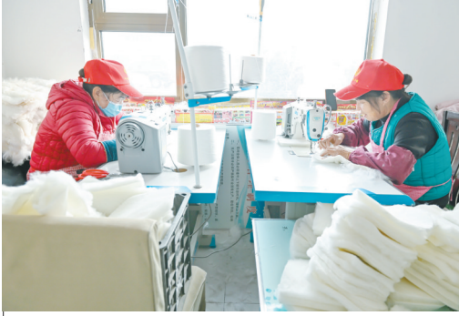
12月9日，平顺县上五井村“微工厂”车间里，村民们正在赶制订单产品。近年来，该村以解决农村留守妇女就业难题为抓手，引进平顺县敏行鞋业有限公司，打造“微工厂”，让村民实现“家门口”就业。

本报讯 通讯员王璐璐报道：近日，壶关县民政局联合消防救援、市场监管等部门，组成检查组对养老机构开展了消防安全、食品卫生大检查。 在检查过程中，工作人员围绕消防安全，对全县养老机构的消防设施、水电气设施是否完好，安全出口、安全及疏散标识，消防安全规章制度和消防应急处置预案，尤其对老人居室、厨房食堂、活动室、线路及配电箱等重点部位进行了全面排查，及时消除各类隐患，筑牢安全防线。同时，工作人员还详细了解机构安全自查情况，对消防设施配备、安全疏散通道以及员工基本的灭火常识等方面进行了全面检查。 为进一步提高养老机构食堂食品安全管理水平，工作人员还重点检查养老机构食堂的主体资质、食品安全管理制度、进货查验台账、原材料贮存、从业人员健康管理及培训开展、食品加工制作过程、餐饮具清洗消毒、食品留样、“互联网+明厨亮灶”、制止餐饮浪费等方面工作，督促养老机构严格落实食品安全“日管控、周排查、月调度”工作机制及相关工作，履行好食品安全主体责任。同时，加强对从业人员食品安全重点环节的指导和培训，提升食品安全风险意识，确保辖区养老机构安全持续稳定。