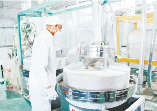
12月6日，长子县鲍店镇西王坡东村石磨面粉加工厂，机器隆隆作响，工人正在有序作业。为开拓市场、打造品牌，该面粉厂与县城各大超市建立合作关系，入驻乡村e镇电商平台，线上线下齐发力，产品深受市场青睐。王娟和红波 摄

本报讯 见习记者李昕泽报道：为进一步做好青年农民培育工作，提升青年农民的综合素养，12月7日，由市农业农村局、共青团长治市委联合主办，长治市伯乐职业培训学校承办的长治市2024年高素质农民培育“农村创新创业暨直播电商青年人才”培训班开班。 本次培训班为期12天，学员为来自全市12个县区基层一线的涉农创业青年、待业青年，旨在帮助学员开阔视野、学习政策、拓展思路、提升能力，围绕直播电商政策、电商助农、农产品营销、长治农产品上行等专题课程，以课堂教学、外出观摩、交流研讨等方式开展。 人才振兴是乡村振兴的基础，农村电商要发展，离不开一支爱农业、懂技术、善经营的青年人才队伍。此次培训充分把握电商发展契机，吸引培育更多的农村电商人才，推动农村发展、农业增收、农民致富。通俗易懂、形式新颖、灵活多样的培训课程，将培训学习与乡土特色相结合、与传统文化相融合，以讲堂育人才，以人才引进项目，以项目带产业，以产业促发展，切实推动青年人才为乡村振兴贡献力量。