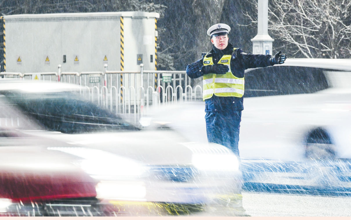
12月10日，我市迎来雨夹雪天气，为确保广大人民群众雨雪天气平安出行，市公安交警部门结合降雪天气和道路通行状况，“以雪为令”，进一步加大路面巡护力度，全面开展各项道路交通安全管理工作，确保雨雪天气道路交通安全畅通。图为市交警三大队交警在指挥交通。石玉成 摄

科技是产业发展的“加速器”。农业生产方面，要推广智能灌溉、无人机植保、环境自动监测、智能水肥一体化系统等技术，降低人力成本，提升农产品产量与质量。农产品加工环节，引入先进保鲜、冻干、精深加工技术，延长产业链条和销售周期，提升附加值。借助电商平台，培训农民电商运营技能，打破地域壁垒，拓宽销售渠道，让农产品“飞”