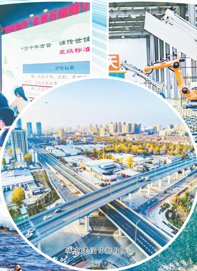
城市建设日新月异

我市始终秉持“对口合作不是对口支援”的理念,围绕将我市打造为“革命老区中国式现代化先行区”的奋斗目标,坚持“互惠互促”的原则,聚焦传承弘扬红色文化、衔接推进乡村振兴和新型城镇化、完善基础设施和基本公共服务、促进生态环境保护修复和绿色低碳发展、共同建设产业合作平台载体五大重点领域,努力打造“四个+”模式。一是打造“北京企业+长治资源”模式。发挥我市矿产、能源、文旅、康养等资源优势,吸引北京市各类企业投入资金556亿元,共同谋划实施140个合作项目,目前已落地开工87个,完成投资近百亿元。二是打造“北京研发+长治转化”模式。联合成立京长对口合作高质量发展研究中心,已集聚20余位资深院士、20余所高校90余名专家教授,开展科技创新联合攻关。已引进北京64项科技成果在我市转化,技术合同交易额1.03亿元。三是打造“北京市场+长治产品”模式。组织开展长治特色产品进京系列活动,共建农产品供京基地近万亩。2022年以来向北京销售农副产品24.6亿元,带动3万户农民户均增收4000元。四是打造“北京总部+长治基地”模式。双方已有4个开发区签订共建协议。我市与北京8所高校、3家企业共建对口合作基地14个,累计投资30亿元。中关村信息谷在山西布局的第一个科创园区——长治·中关村信息谷创新中心正在加快建设。同时,我市积极对接北京优质资源,两地已有20家医疗卫生机构、41所院校建立结对合作关系。