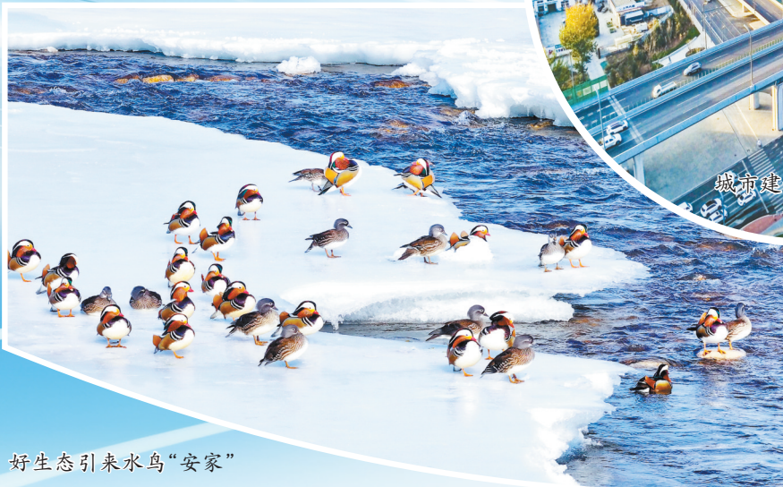
好生态引来水鸟“安家”

北京、山西和长治高度重视京长对口合作,北京市、山西省政府主要领导开展专题座谈,分管领导多次带队互访,我市领导多次赴京对接。我市12个县区与北京12个区建立结对合作关系,互派挂职干部26名,联合举办对口合作活动160余场次,签订合作协议160余个。