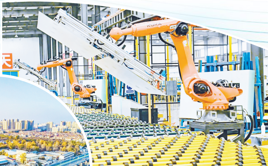
智能生产线让生产更高效