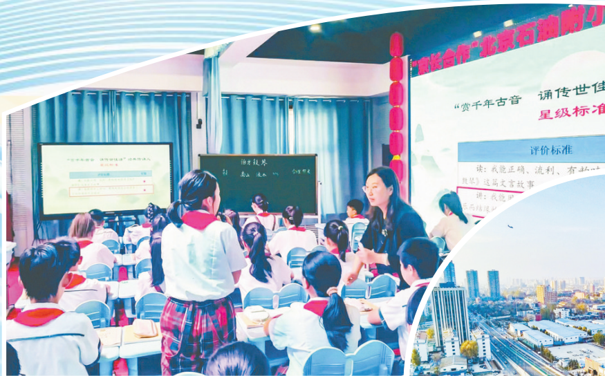
课堂教学呈现新气象

守护浊漳河安澜健康,做好治水兴水大文章,是我市义不容辞的责任和使命。我市深入推进“八百里浊漳·美丽的画廊”母亲河生态修复治理工程。坚持规划引领。编制了现代水网建设规划,今年7月被水利部确定为第二批市级水网先导区。制定了《八百里浊漳水生态保护与高质量发展规划》,出台了《全面实施八百里浊漳河流域生态修复治理工作方案》,提出6方面30项具体任务。坚持项目带动。围绕八百里浊漳水生态保护与高质量发展,共谋划项目197个,总投资198亿元。今年重点实施了80个项目,已完成投资27.5亿元,其中12个项目已完工。着眼于提高粮食单产,规划了上党50万亩大型灌区等一系列水利设施,项目已列入《全国农田灌溉总体规划》,建成后将新增有效灌溉面积20.2万亩、增加粮食产量0.7亿斤。坚持试点先行。今年4月,绛河入选全国2024年度幸福河湖建设试点,获得国家补助资金7000万元,成为海河流域和山西省首批国家幸福河湖建设试点。坚持以奖促治。安排2000万元市级财政资金,专项用于奖励河湖生态修复治理工作进展快、效果好的县区。