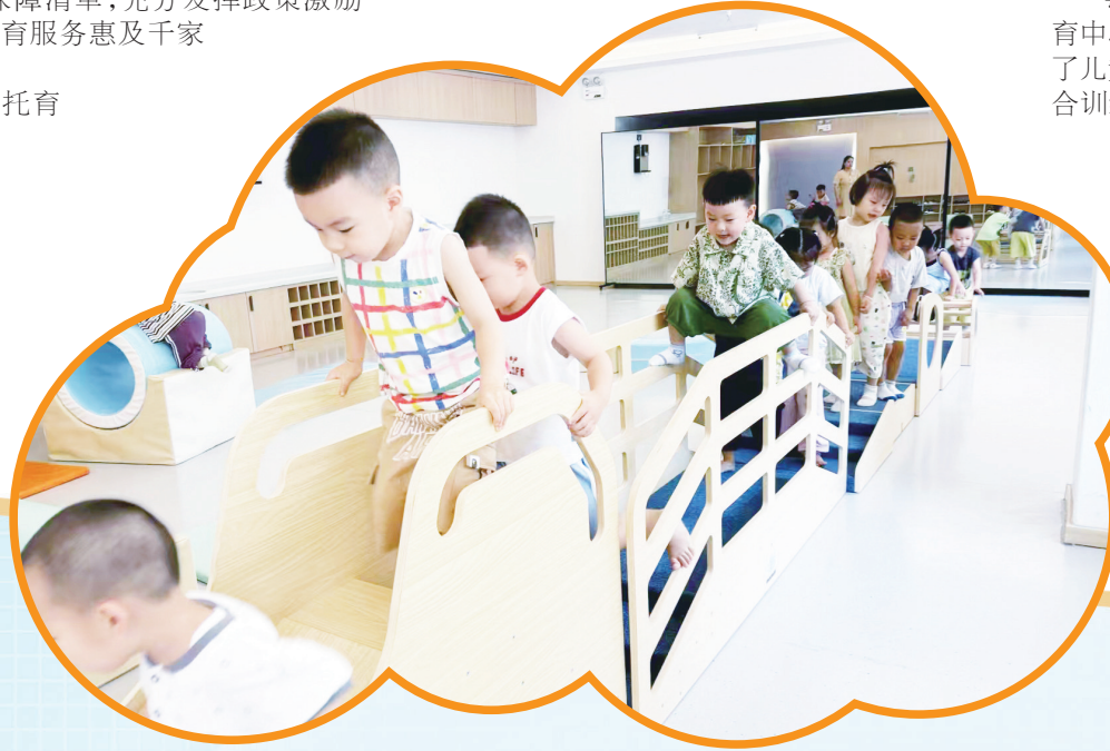
丰富多彩的托育课程

统筹育幼资源，扩大托位供给，提高托育服务水平，努力实现方便可及、价格可承受、质量有保障、发展可持续的普惠托育服务，满足人民群众“幼有所育”“幼有善育”的服务需求，我市努力破难题、探新路、作示范，为促进人口长期均衡发展作出新的更大贡献。