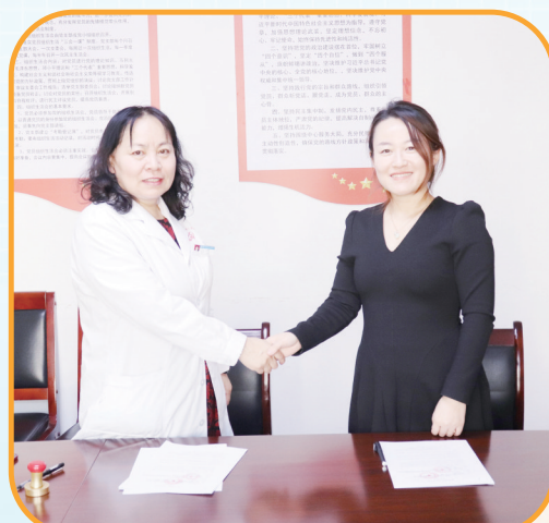
医疗机构与托育机构签约