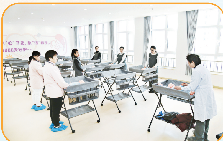
开展婴幼儿照护指导