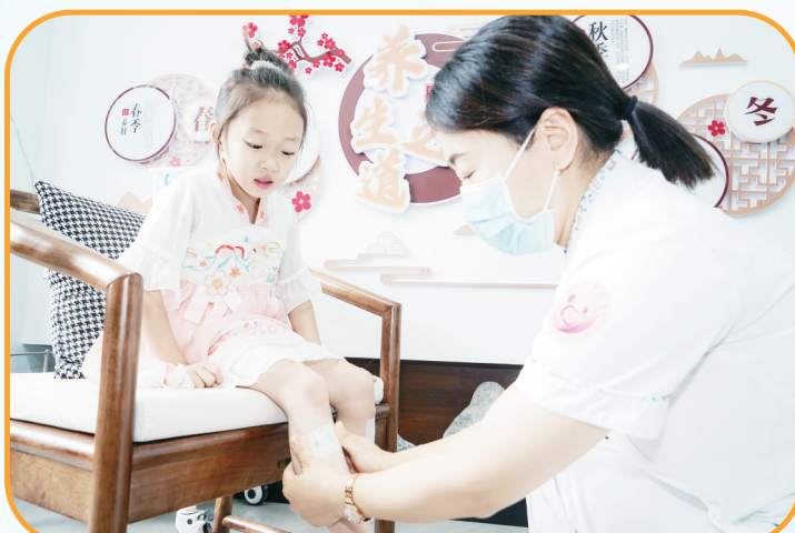
特色化中医儿保健服务