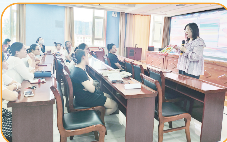
妈妈课堂培训现场