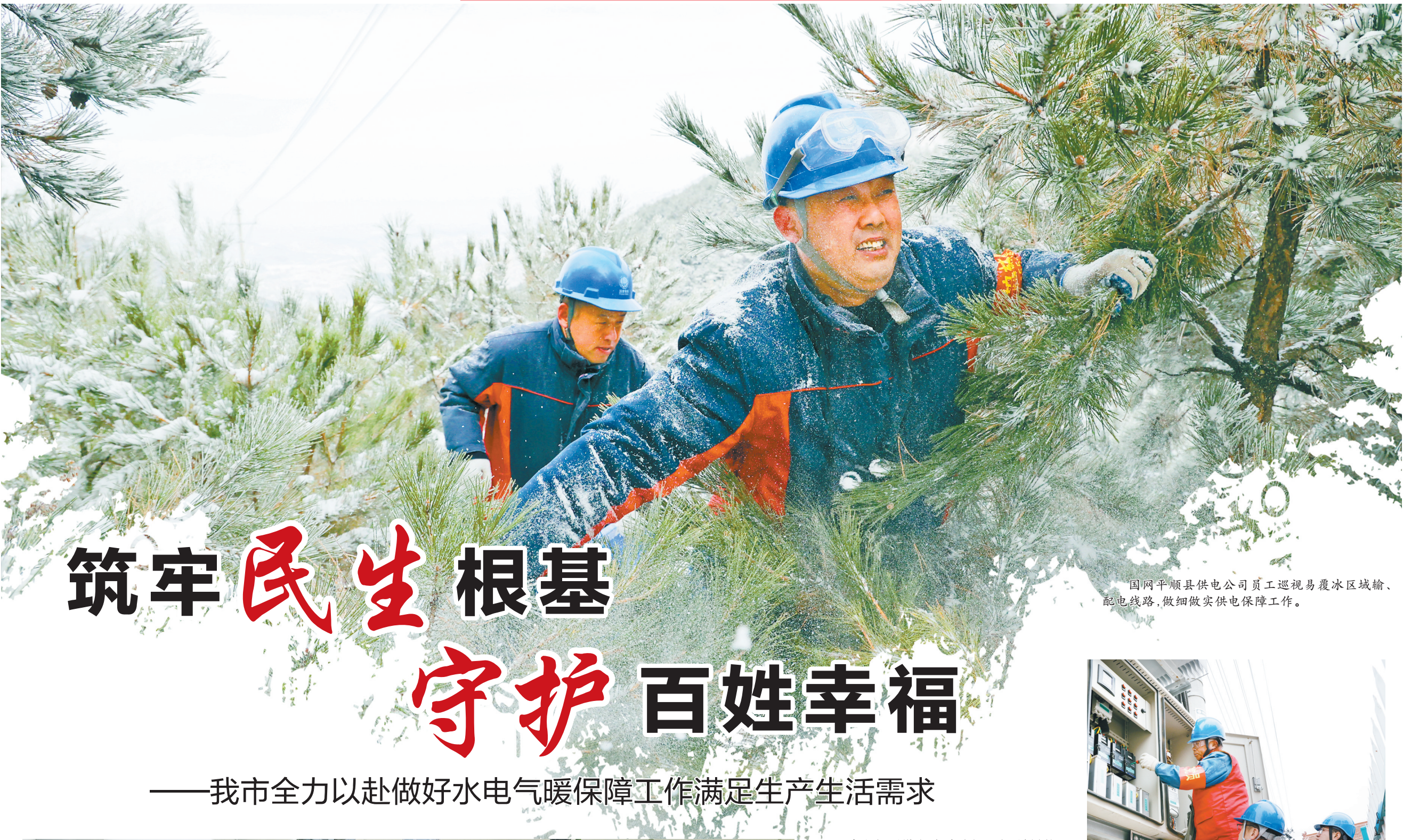
国网平顺县供电公司员工巡视易覆冰区域输电、配电线路，做细做实供电保障工作。