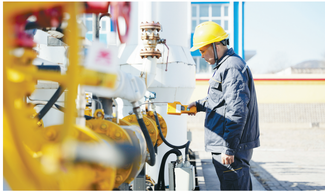
长治华润燃气有限公司对输气设备进行检查维护，全力保障燃气安全平稳供应。