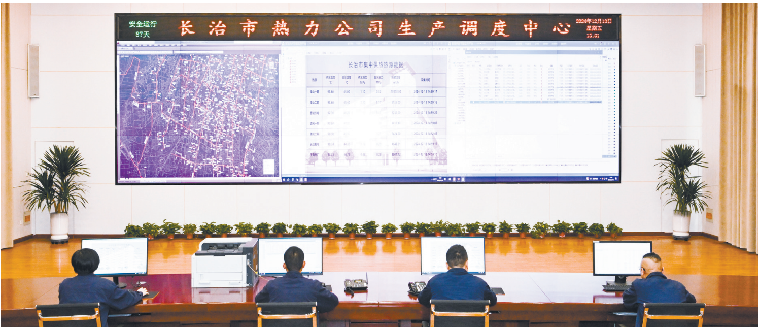
市城镇热力有限公司24小时实时监控，守护万家温暖。