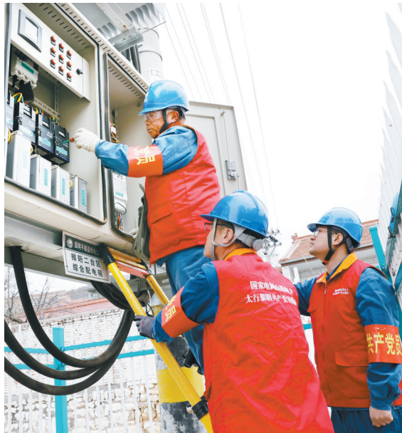
国网长治供电公司太行黎明共产党员服务队检查配电柜设备，确保冬季电网安全稳定运行。