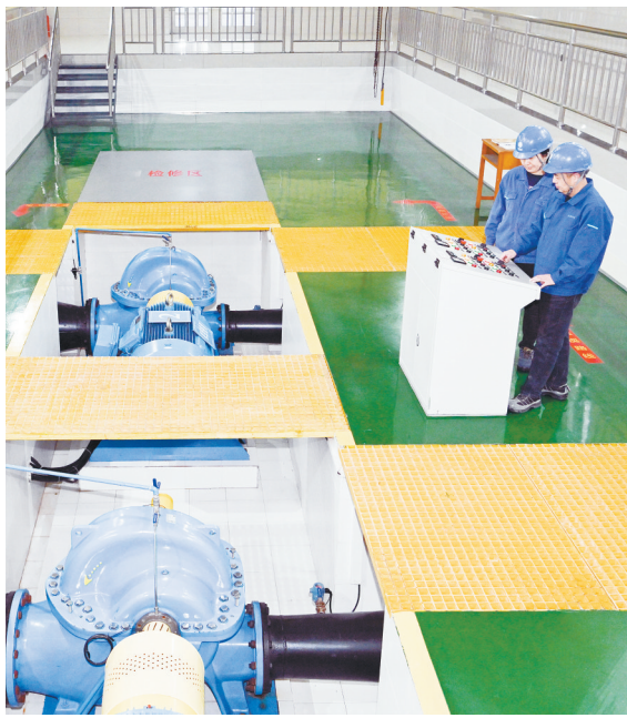
市城镇供水集团对设备进行安全检查，消除潜在冰冻隐患。

守好温暖防线。 市城镇热力有限公司制定冬季保供方案，进行专项工作部署。一方面加强与供热电厂的沟通，保证热源稳定供应；另一方面强化精准调控，根据天气变化科学合理调节供热参数，增加换热站巡检频次，确保设备处于良好状态。与此同时，应急队伍及车辆随时待命，确保如遇供热突发事件能够及时高效处置。