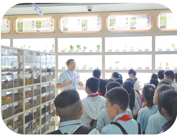
研学拓展视野,实践赋能成长。

为弘扬中医国粹、传承中华优秀传统文化，扎实推进中医药文化进校园工作，近年来，潞州区下南街小学将中医药文化纳入学校日常教学工作，以“阵地+课程”为载体，融合“五育”，多维度推动中医药文化传播，让学生感受中医药历史底蕴，激发学习热情，提升文化自信，实现文化育人，走出一条以中医药文化浸润学生成长的特色之路。