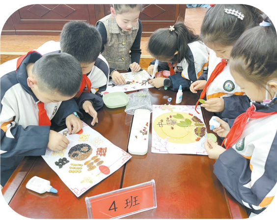
创新学科融合,丰富教学内涵。

校园文化能够潜移默化地影响师生，是学校的隐性课程。2021年3月，潞州区下南街小学与市中医研究所附属医院联手建立长治市首个“中医药文化进校园科普基地”，并以“承神农文化、传本草精华，续中医神奇”为使命，结合项目式学习积极创建“中草药种植园”、打造“中医药文化厅”、设置“中医药宣传栏”等教育环境，营造中医药文化氛围。