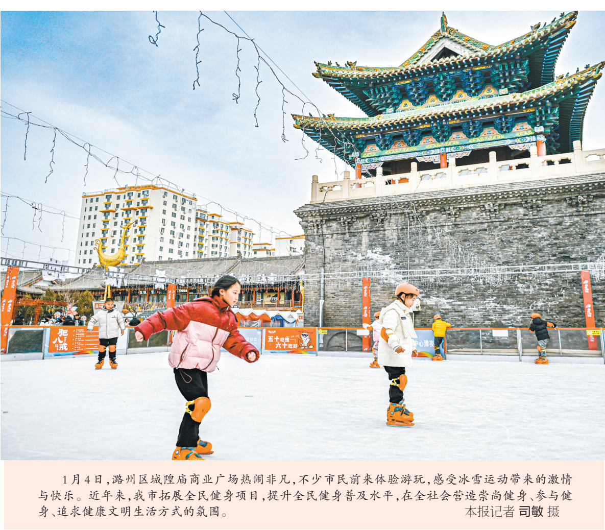
1月4日,潞州区城隍庙商业广场热闹非凡,不少市民前来体验游玩,感受冰雪运动带来的激情与快乐。近年来,我市拓展全民健身项目,提升全民健身普及水平,在全社会营造崇尚健身、参与健身、追求健康文明生活方式的氛围。

(上接第一版) “市委十二届七次全会暨市委经济工作会议精准谋划全市经济工作,让我们信心更坚定、干劲更高昂,同时目标更明确、思路更清晰。”山西文旅红星杨公司党支部书记、董事长周毅表示,将深入学习贯彻会议精神,以全国红色旅游融合发展试点单位建设为契机,加快推进八路军文化旅游区国家5A级景区创建。在提升景区品质、创新旅游业态、做强旅游品牌、提升服务水平上持续发力,加快形成“红色旅游吸引人,红色精神感染人,融合产业留住人”的集聚效应,进一步提升红色文化市场带动能力,真正让武乡红色旅游“出新”“出圈”“出彩”。 “我们要坚持千字当头,全力贯彻落实市委十二届七次全会暨市委经济工作会议精神。坚持市场化导向,深化旅游供给侧结构性改革,推动黄崖洞文化旅游区国家5A级景区创建。”黎城黄崖洞文化旅游区董事长吴定旺进一步明确了今年工作思路。他表示,要深入了解游客需求,明确目标市场,为后续产品开发和营销策略制定提供依据。 持续完善基础设施建设,开发特色旅游产品,引入户外拓展、主题研学等项目,提升旅游服务保障能力,提高游客满意度。同时,推广“音乐+旅游”“演出+旅游”“赛事+旅游”等业态,举办特色节庆活动,打造网红打卡点,形成旅游爆点,吸引更多游客前来参与和体验,进一步提升景区的品牌知名度和美誉度,更好地推进国家5A级景区创建,实现旅游业高质量发展。