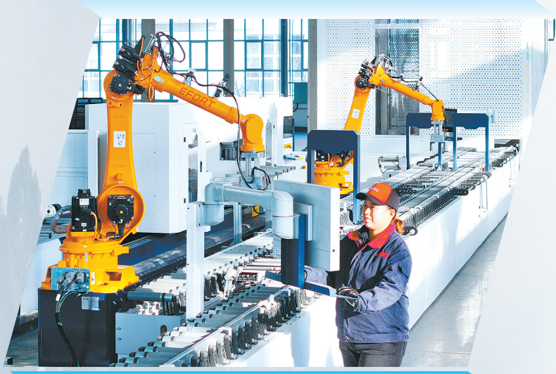
中德集团中德家系统门窗全自动化生产车间