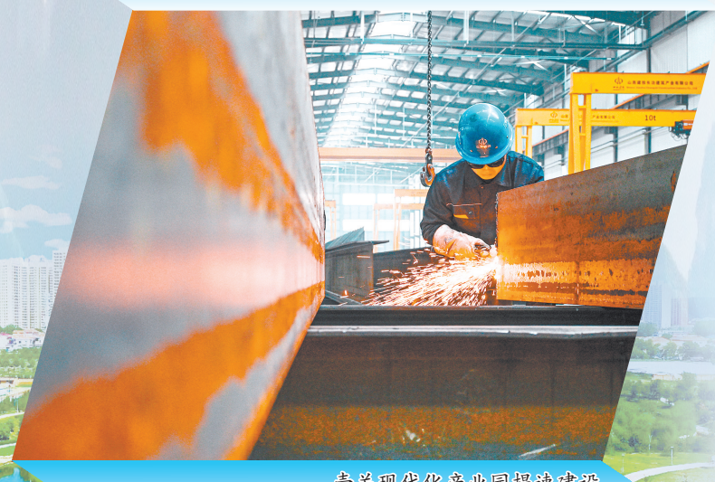
壶关现代化产业园提速建设