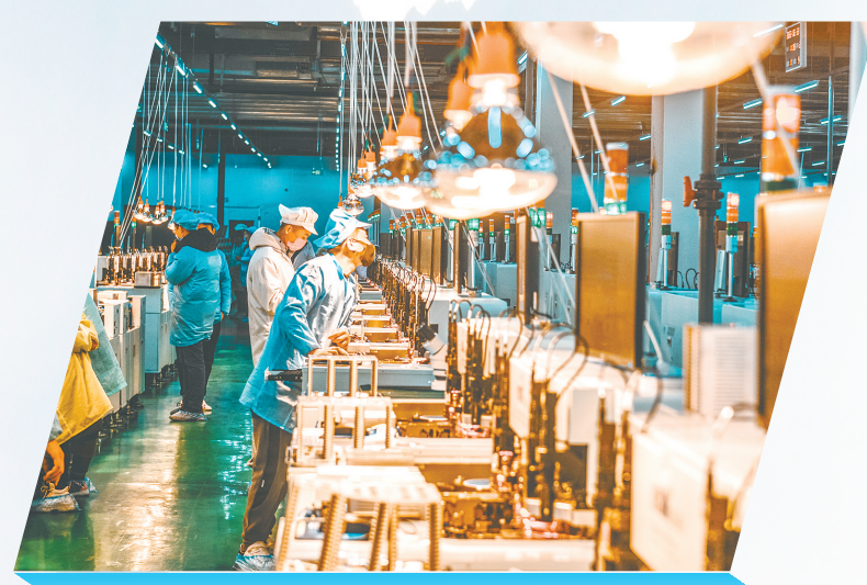
高科华杰智能化生产线

产业转型是城市发展的必由之路，更是长治迈向高质量发展的关键抉。市委十二届七次全会暨市委经济工作会议强调：“要抢抓新一轮科技革命和产业变革的时代机遇，加快构建现代化产业体系，走出一条结构优、质量高、可持续发展的新路。”传统产业如何“换骨”转型，新兴产业怎样“脱胎”新生？目标愿景不是等来的、喊来的，而是拼出来、干出来的。看我市各职能部门和企业在会议精神引领下，如何以“开年即奔跑、起步即冲刺、开局即决战”的奋进之姿，扛牢使命担当、奋发实干作为，为 2025 薪新开局。