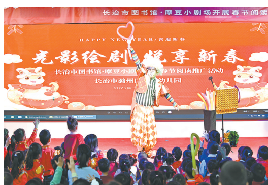
1月9日，市图书馆携手市绘本剧摩豆小剧场走进潞州区科教幼儿园，为孩子们带来别开生面、新颖独特的绘本剧故事。

群众学习专业技能，促进增收创收，实现“一技在手，走遍天下”。为实现“企业就近用工、群众就近就业”，产业园办活动、搭载体，充分发挥就业服务站和零工市场作用，举办“春风行动”专项招聘活动、“雨露计划+”就业促进行动专场招聘会、“现场招聘+直播带岗”专项活动，为求职者和用人单位“牵线搭桥”。截至目前，累计举办招聘会149场次，提供岗位1.38万余个，共达成就业意向5000余人。