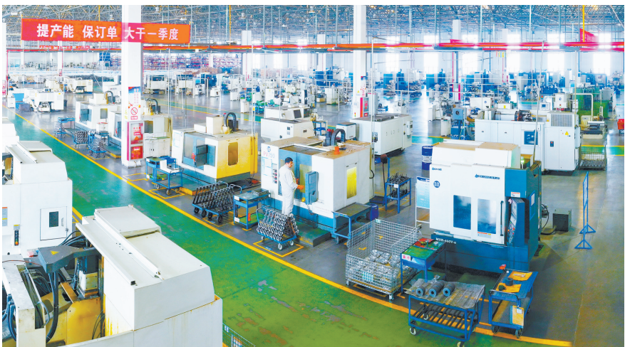
1月10日,太重榆液长治液压有限公司叶片泵车间内,员工们开足马力,加快生产赶订单,全力冲刺“开门红”。该公司始终坚持科技创新,推动产品向系列化、规模化迈进,产业链、价值链向高端延伸。

吴小华强调,要牢固树立以人民为中心的发展思想,时刻把群众的需求放在心上,认真落实好相关帮扶救助政策,不断增强人民群众幸福感和满意度。要带着感情和责任,及时为困难党员和群众排忧解难、多办实事,做到生活上多照顾、精神上多鼓励,用心用情用力解决实际困难,让他们感受到党和政府的关怀与温暖。要不断增强工作积极性和主动性,因地制宜谋划产业发展,多渠道拓展就业空间,激活乡村振兴内生动力,全力推动农业增效益、农民增收收入、农村增活力,让乡村振兴成色更足、底色更亮。吴小华还叮嘱支村两委干部和驻村工作队,要切实做好森林防火和温暖过冬保障工作,让人民群众度过欢乐祥和的新春佳节。