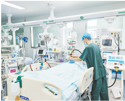
ECMO联合俯卧位通气与振肺排痰治疗。

段，增强了患者的呼吸肌力量，改善了患者肺通气功能，为后续脱离ECMO支持及整体康复奠定了坚实基础。 据介绍，ECMO技术被称作体外膜肺氧合技术，是危重症急救水平的一项先进技术，也是生命支持的一种救治手段。假如患者的肺脏失去了氧合能力，那么ECMO技术就能为患者争取生机，替代肺脏呼吸换气，将氧气输送到身体里。但是临床应用却不是那么轻松的，要求重症医护人员全身心全天候地精心照护，一刻不离。 终于，经过不懈努力，患者于1个月后康复出院。家属为表达谢意，专程为科室送来了一封感谢信，溢于言表的褒奖、充满深情的感谢，字字句句都是信任，令在场的医护人员深深感动。