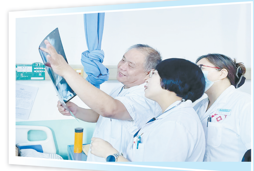
优质医疗资源下沉惠民