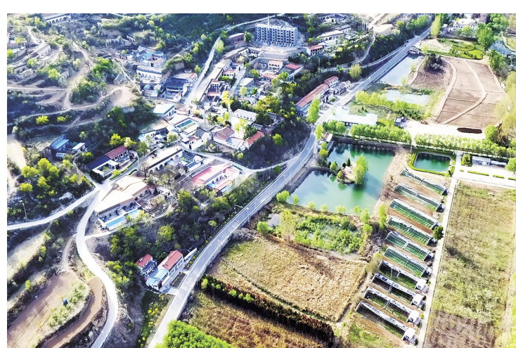
西流南村美景入画来