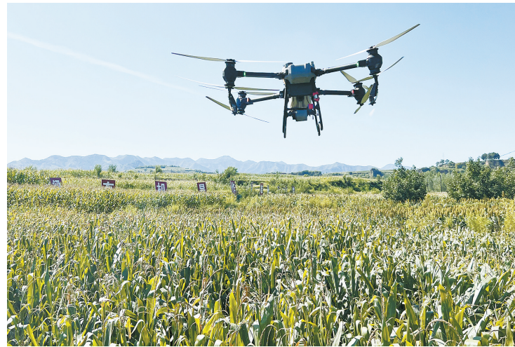
“飞防”作业助力智慧农业发展