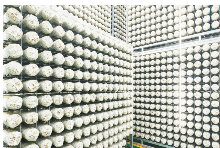
香菇出口助农增收