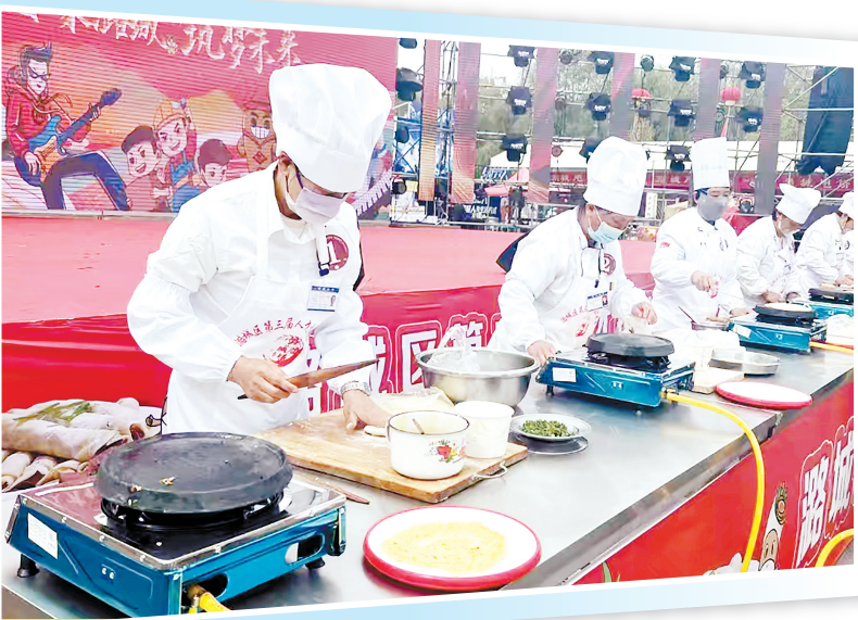
驴肉甩饼大赛点燃文旅融合新火花

深入学习运用“千万工程”经验，坚持农业农村优先发展，坚持城乡融合发展，牢固树立和贯彻落实“两山”理念，实现“美丽田园”和“美丽经济”效益双提升。 微子镇山头村，将红色基因融入山水、产业，为乡村振兴赋能添力；辛安泉镇南流村，一湾泉水环绕亭台轩榭，为正在建设的“上党地区第一家水稻产业园”打好基础；潞华街道岭后村，在旱地特色种植上做文章，为人居环境改善带来充足底气；…… 今日潞城，乡村振兴气象万千，有颜值更有实力，产业发展势头良好，农村集体经济大提质，村民腰包越来越鼓。 潞城区在学习运用“千万工程”经验的过程中，牢固树立和贯彻落实“两山”理念，统筹好乡村建设和经济发展的关系，努力打通“绿水青山”和“金山银山”的转化通道，实现“美丽田园”和“美丽经济”效益双提升。 政策支持精准有力。印发《学习运用“千万工程”经验纵深推进“一区两地”全力构建和美乡村行动方案》《学习运用“千万工程”经验推进乡村振兴全面振兴2024年工作要点》等政策文件，推动镇道街街道进村、微子镇山头村等4个精品示范村完成村庄规划编制，谋划22个重点项目，总投资2.16亿元。辛安泉镇西流南村碳芳园提档升级项目顺利完成，开门迎客。 特色产业优势彰显。潞城区连续第8年出台农业调产政策文件《长治市潞城区2024年以奖代补推进一产高质量发展的实施意见》，中药材、高油、大葱、香菇、设施蔬菜、旱地西红柿和冬播谷“6+1”特色种植面积超过10万亩，建成大葱产业园，全面补齐育苗、加工销售、体验全产业链条，年产值实现8000万元，提供就业岗位3000余个。引进香菇制棒自动化生产线，建成全省唯一集制棒、养菌、出菇、保鲜加工、销售于一体的食用菌产业综合示范区，辐射带动全区5个乡镇（街道）22个村建设香菇大棚200多座，香菇年产量超过4000吨，产值4000万元，带动1000余户农户增收致富，香菇产业成为具有潞城特色的重要支撑产业。 文旅融合赋能乡村振兴。目前，卢医山滑雪场、潞阳里美食城、辛安泉乡村旅游持续火热，吸引许多游客前来游玩体验。随着黄花岗长安军事文化公园开工建设，神头之战纪念馆3A级旅游景区、八路军总部北村旧址3A级旅游景区提档升级项目稳步推进。潞城区各类文旅康养资源串点成线、连线成面，短途旅居、研学旅居基地初步形成，强势赋能乡村振兴。 一次次创新性探索、一个个突破性进展、一项项标志性成果，镌刻着潞城区改革步履的铿锵印记。 立足新发展阶段，贯彻新发展理念，构建新发展格局，推动高质量发展，潞城区大胆试、大胆闯、主动改，在重点领域上先行探索，在体制机制上大胆创新，在堵点难点上破题开局，在试点示范上下足功夫，持续以改革创新引领发展突围，推进各领域改革出圈出彩，一步一个脚印走好高质量发展之路。