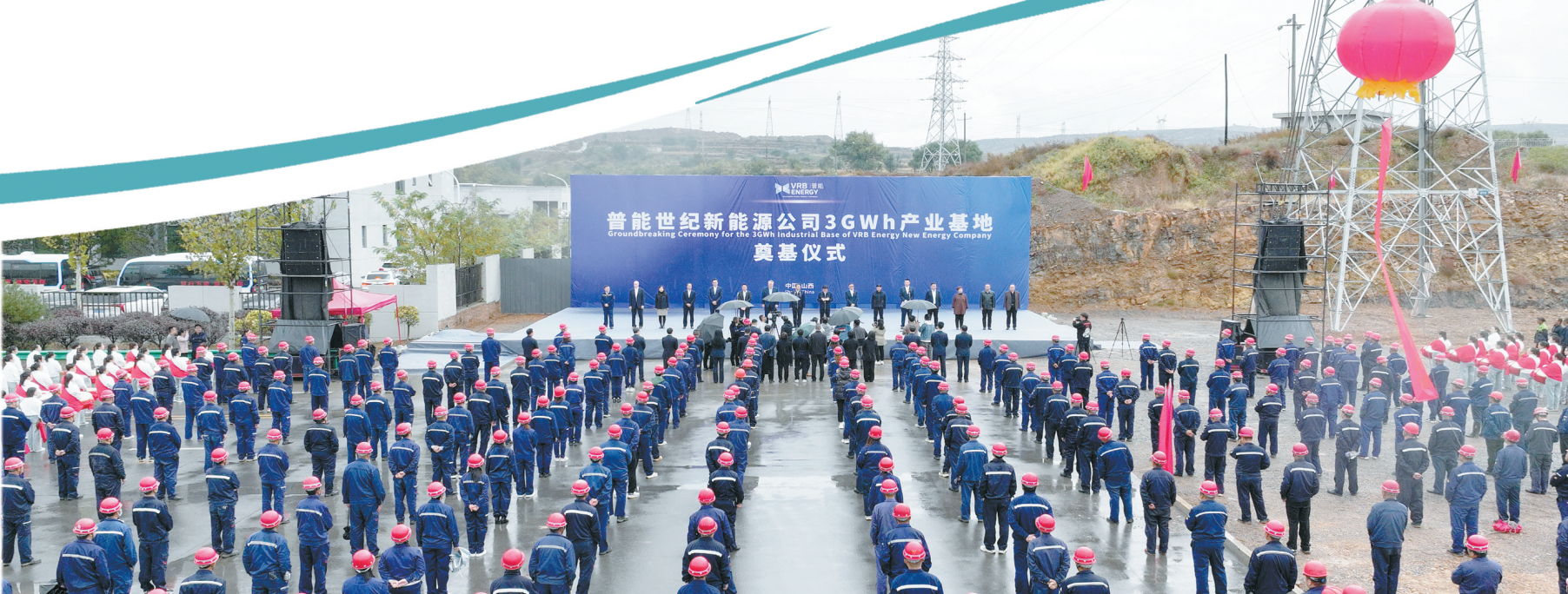
普能世纪新能源有限公司3GWh全钒液流储能产业项目奠基