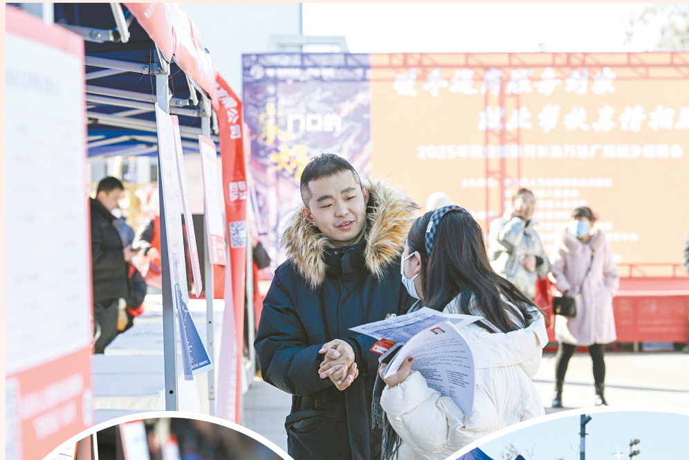
1月19日,我市2025年就业援助月专项招聘活动在万达广场举行。活动以“暖冬送岗服务到家就业帮扶真情相助”为主题,旨在为高校毕业生、外来务工人员等重点群体及用人单位搭建有效的对接平台。招聘会现场,来自省内外外的45家招聘企业共提供岗位2000余个。