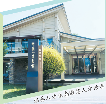
涵养人才生态激荡人才活水