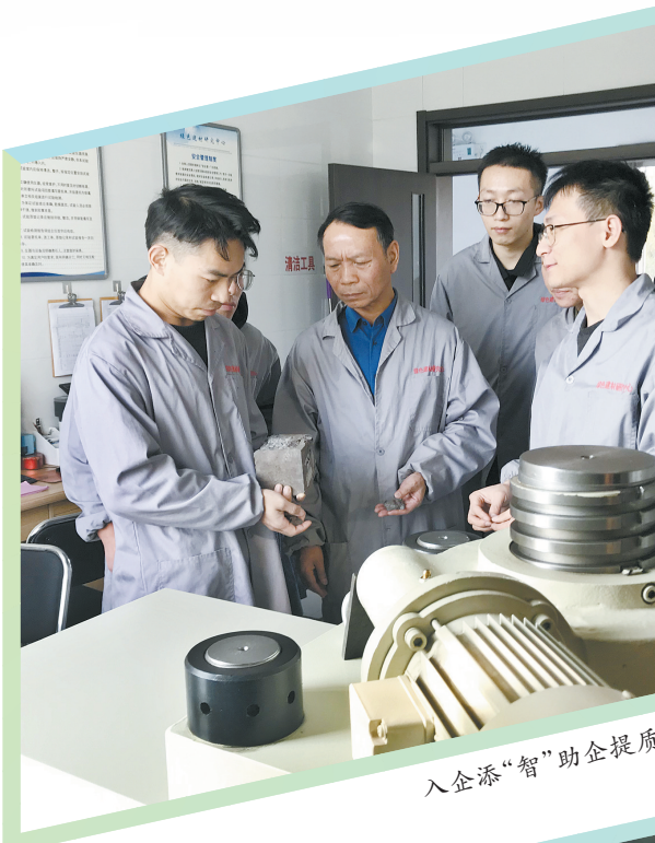
入企添“智”助企提质