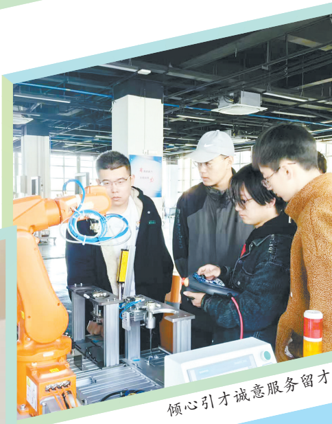
倾心引才诚意服务留才