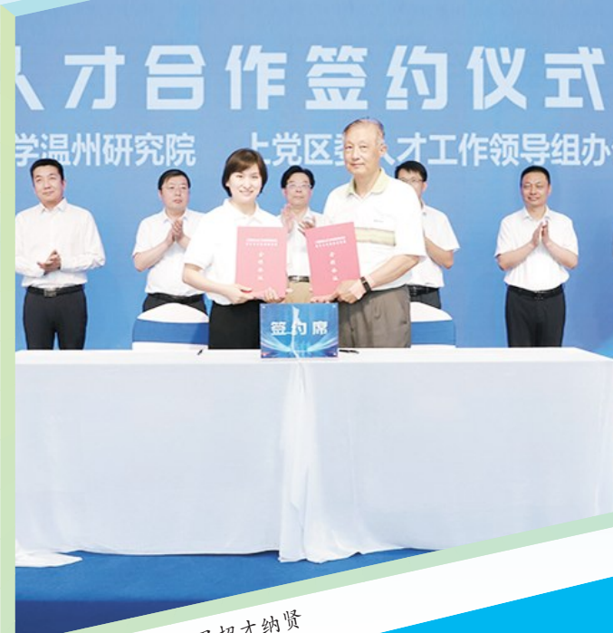
奔赴千里招才纳贤