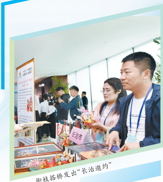
街枝搭桥发出“长治邀约”

此心安处是吾乡。盯紧人才生活“关键小事”，2024年，我市全年共发放生活补贴1045人1392万元，购房补贴43人240万元。全市建成各类人才公寓3909套，2024年入住174人，累计入住1.58万人次，以“真金白银”托举人才无忧。