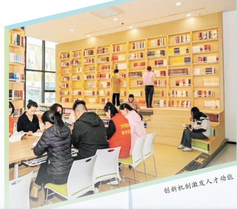
创新机制激发人才动能