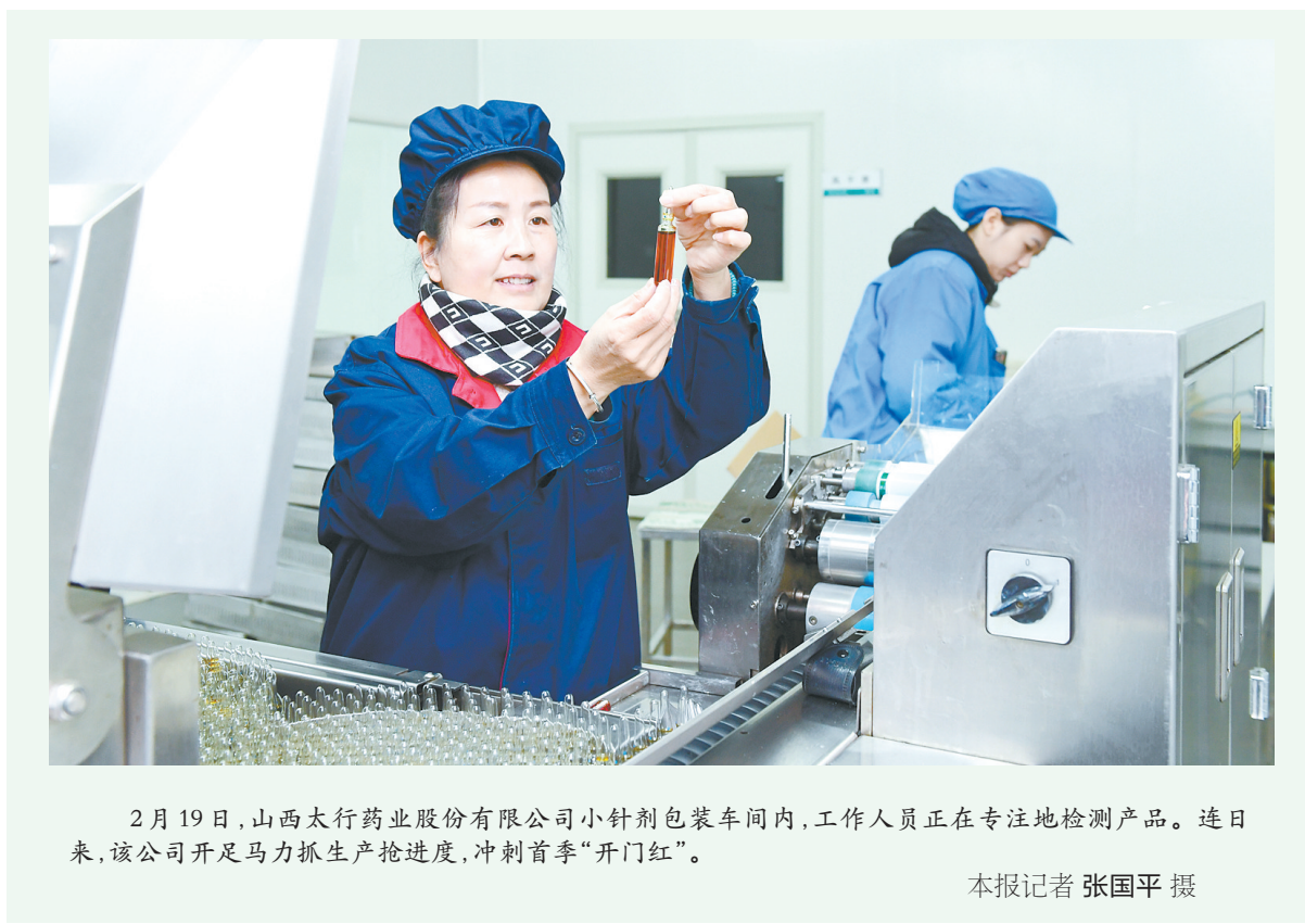
2月19日，山西太行药业股份有限公司小针剂包装车间内，工作人员正在专注地检测产品。连日来，该公司开足马力抓生产抢进度，冲刺首季“开门红”。