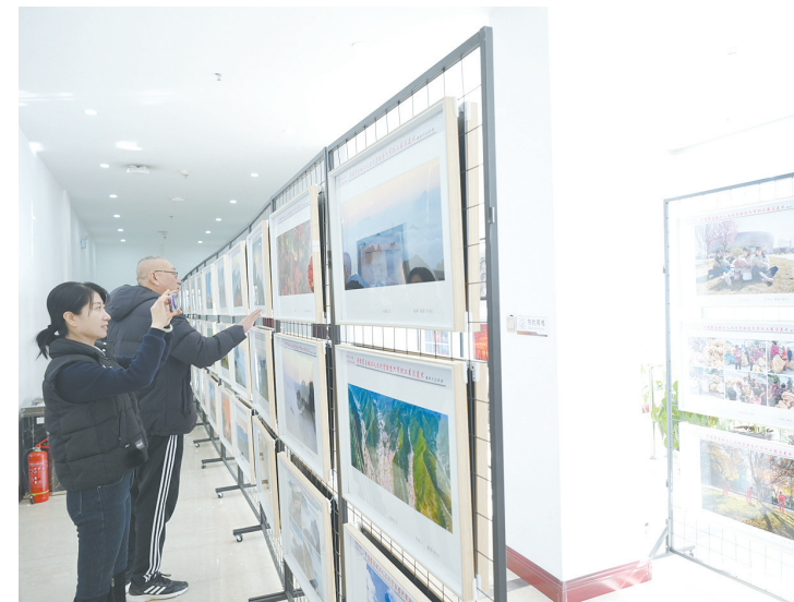
近日，晋豫冀区域工人文化宫联盟六市职工书法美术摄影作品联展在长治市工人俱乐部开展，该展览以“劳动创造幸福、奋斗铸就伟业”为主题...