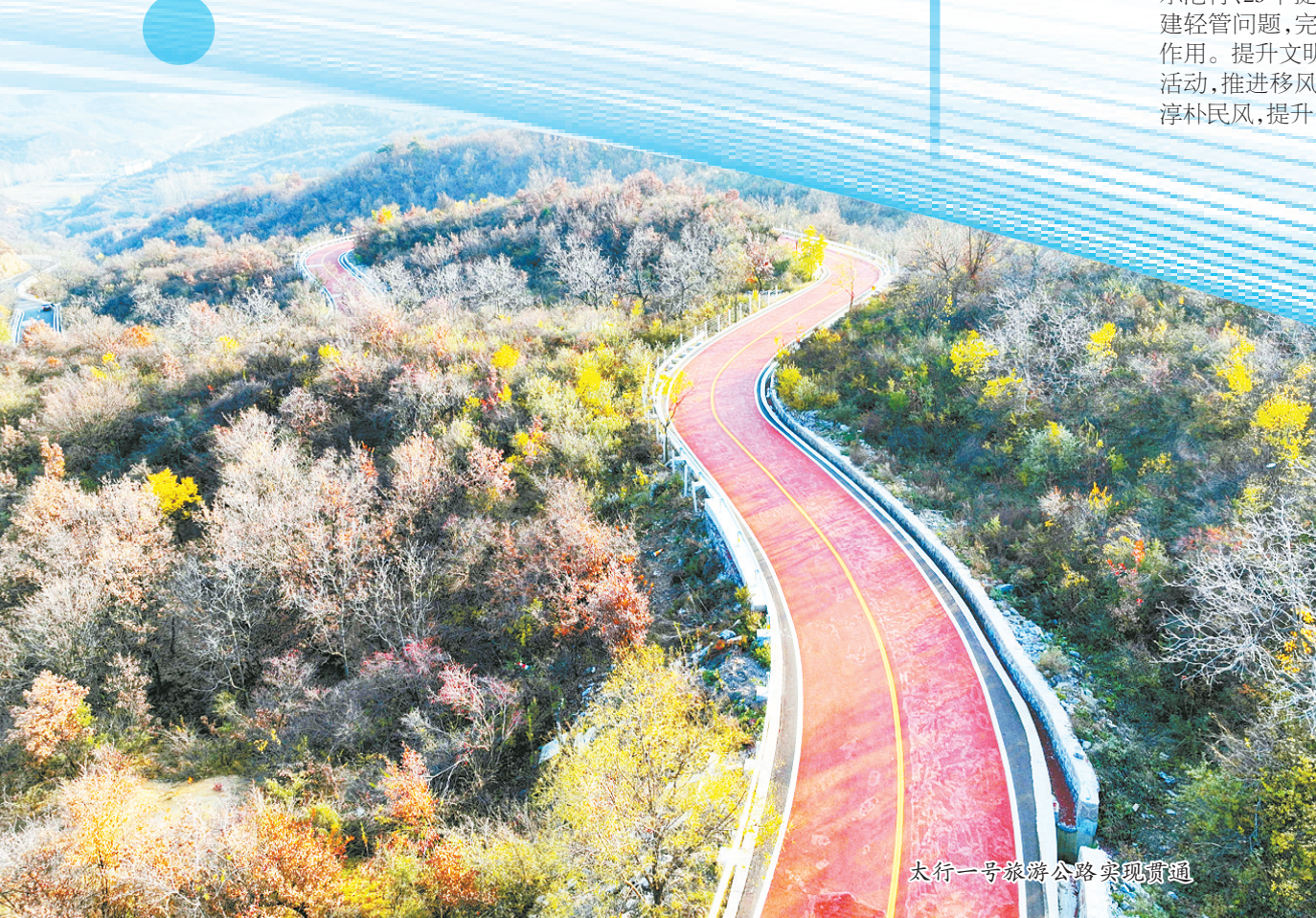
太行一号旅游公路景观节点