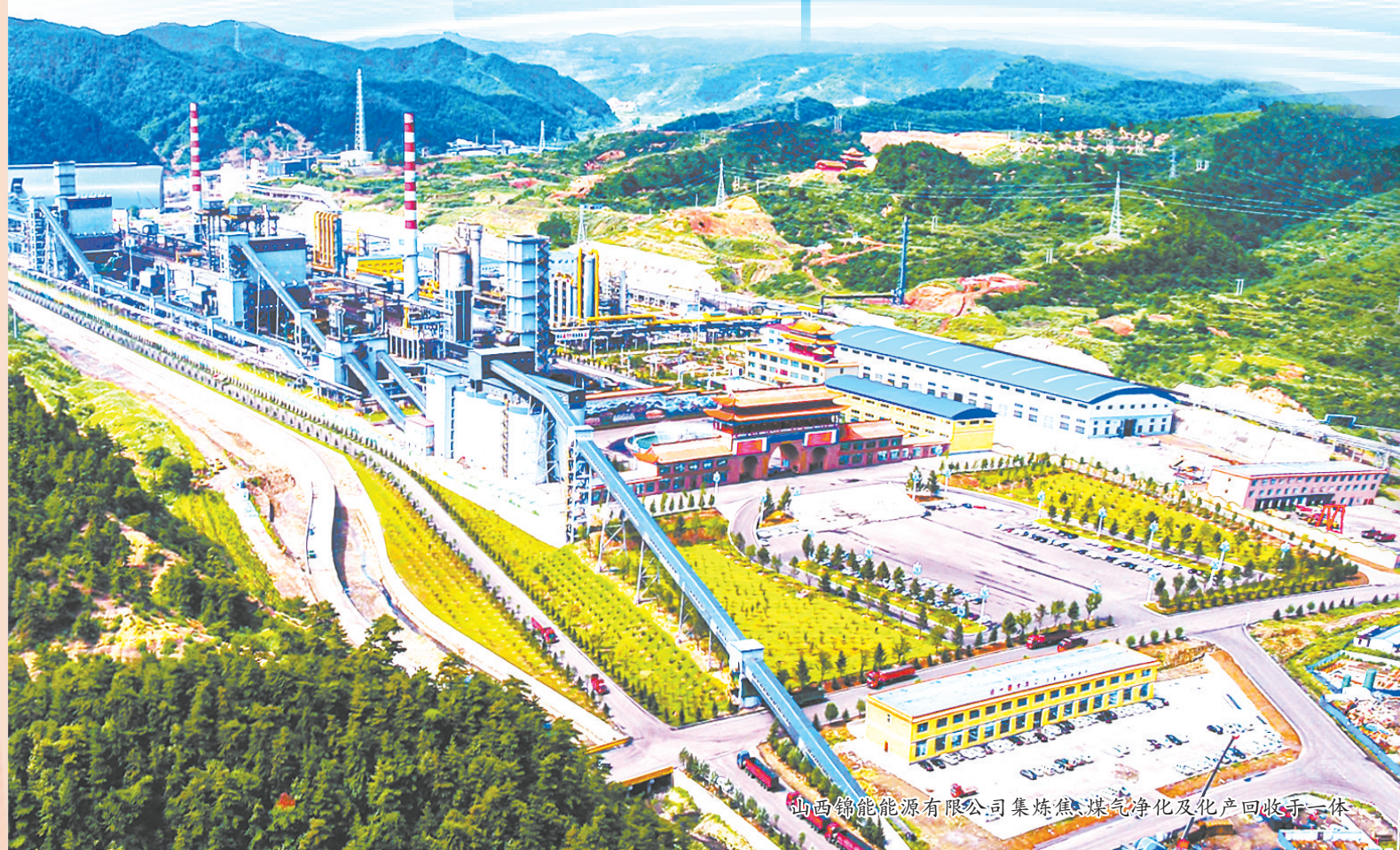
沁源能源有限公司集煤储煤净化及化产回收于一体

要生态固碳,按照市委“建设沁河生态走廊”要求,一体推进控污、调水、清淤、添绿、增产。持续开展义务植树,实施国土绿化示范项目,人工造林1.1万亩,封山育林5.8万亩,森林质量精准提升1.9万亩,修复治理历史遗留矿山77.88公顷,强化森林水库、粮库、钱库、碳库功能。加强生物多样性保护,规划建设五龙川野生植物展示馆,沁河源野生动物展示馆,打造自然教育与研学旅游基地。生产降碳,推进能源、工业、农业、交通运输、城乡建设等领域绿色低碳转型,加快煤焦企业“超低排放”和干熄焦改造,促进“能耗双控”向“碳排放双控”转变。探索煤矸石、粉煤灰资源化利用新模式,变废为宝,变害为利。持续完善企业中水回用设施,将33个村污水收集设施纳入城乡供排一体化运营体系。推进秸秆农膜回收利用,化肥农药减量增效,畜禽粪污资源化利用。“一指标一策”整治大气污染突出问题,加强扬尘治理,力争把PM 10 、PM 2.5 浓度降下来,牢牢守住生态环境“只能变好,不能变差”的底线要求。生活低碳,加快推进电动汽车充电基础设施建设,按照车桩比3:1标准,在机关单位、停车场等公共区域新布局一批充电桩。持续推进住宅小区电动自行车棚与充电桩(口)建设,为群众绿色出行赋能增效。开展“垃圾分类、节能减碳”全民行动,形成人人、事事、处处崇尚生态文明的社会氛围。