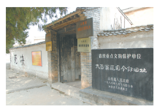
太岳军区司令部旧址