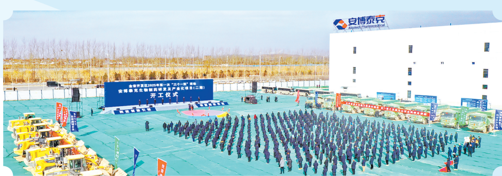
全省开发区2025年第一次“三个一批”活动在我市举行