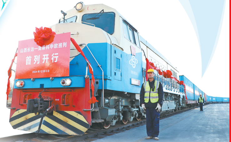
首列中欧班列开启

2024年,市商务局坚决贯彻落实省、市安排部署,坚定不移推动开发区改革创新,坚定不移抓好开发区招商引资和项目建设,各开发区(示范区)充分发挥“主战场、主阵地、主引擎”作用,持续掀起项目建设热潮。全市“三个一批”累计签约、开工、投产项目173个,总投资504.97亿元,签约开工率达90.65%、投产率达29.04%、达产率达100%,综合评价全省第一。 产业发展布局持续优化。2024年,我市对13个省级及以上开发区主导产业进行规范,将原批复的3个主导产业进一步聚焦为1至2个主导产业,以“+N”模式做大做强全产业链。全市开发区积极对接东部地区产业转移,紧密围绕产业“链主”需求,针对弱链断链精准招商,积极承接技术密集、绿色低碳产业,加速产业集群成形。在全省承接东部地区外商制造业产业转移工作评价中,我市排名第一。 “三化三制”改革持续深化,“承诺制+标准地+全代办”三项改革加快推进。2024年,全市开发区16家平台公司共招引项目47个,总投资100.42亿元,完成基础设施建设投资19.84亿元。全市开发区共实行承诺制项目370个,可实现承诺制项目100%实现承诺;出让标准地41宗,出让面积2396.97亩,开发区工业用地全部以标准地出让;实行领办代办项目462个,代办项目比例100%。