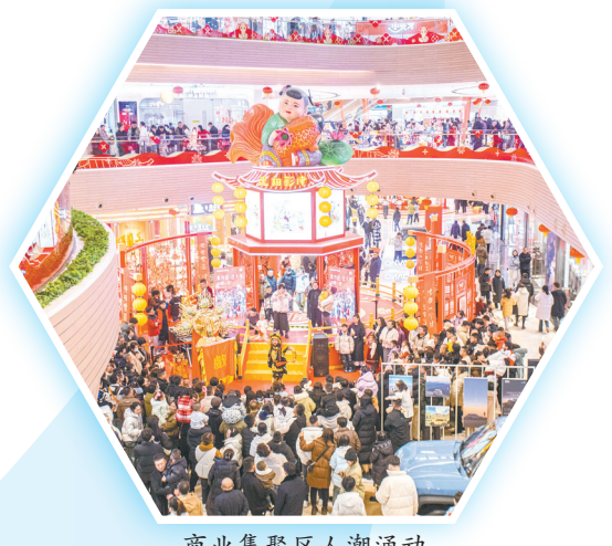
商业集聚区人潮涌动