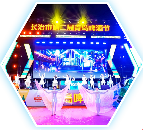
啤酒节焕发消费新活力