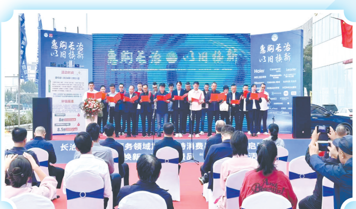
以旧换新激发市场活力