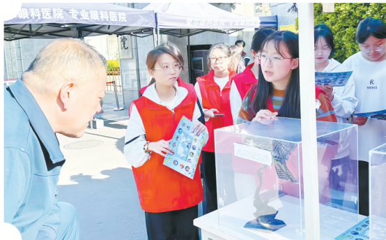
第43届“爱鸟周”宣传活动