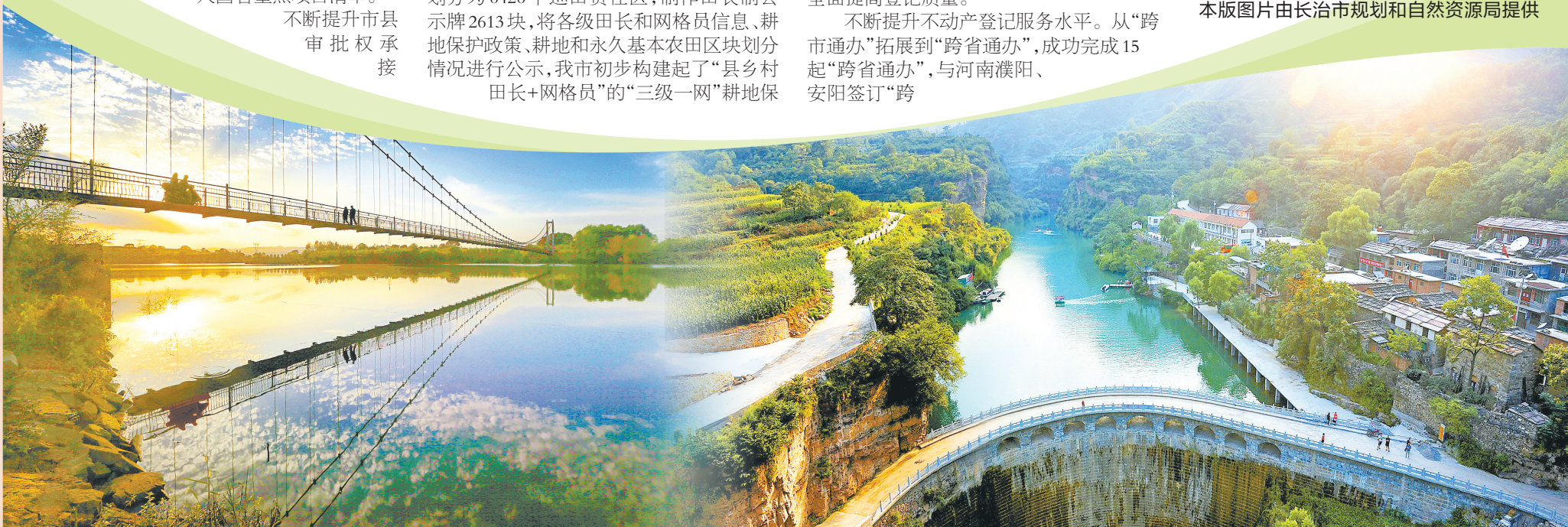
长子县精卫湖日落