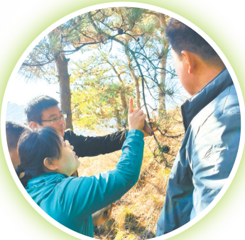
林草专家对油松病虫害识别鉴定