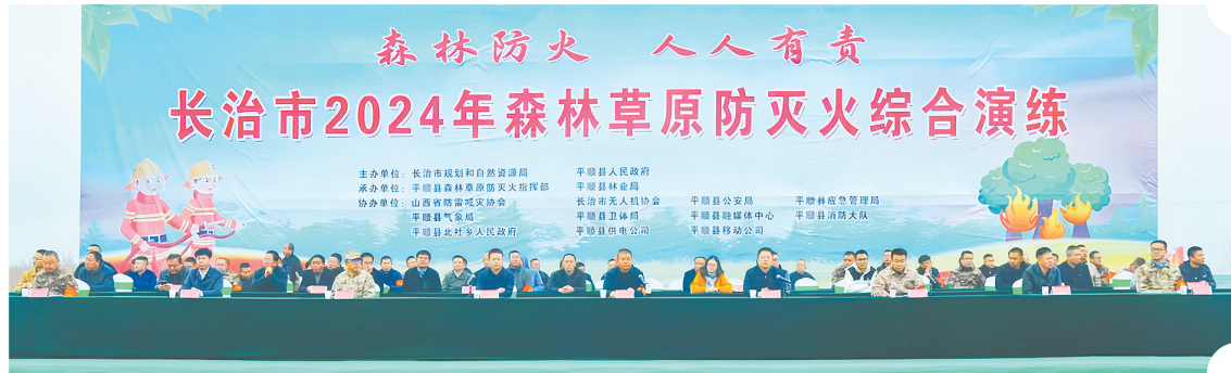
森林草原防灭火综合演练