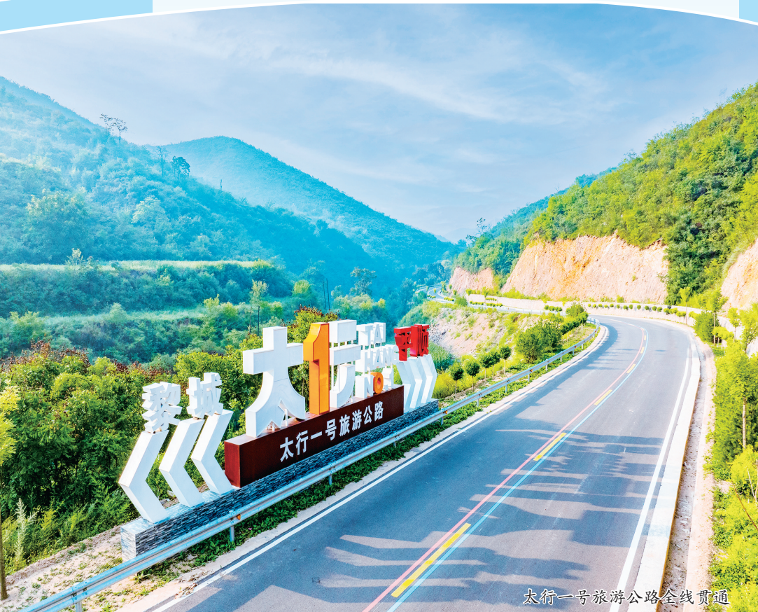
太行一号旅游公路全线贯通