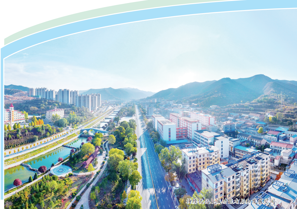
昌沁路沿线景观提升工程效果图