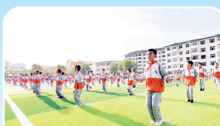
教育系统持续推动优质资源再扩容