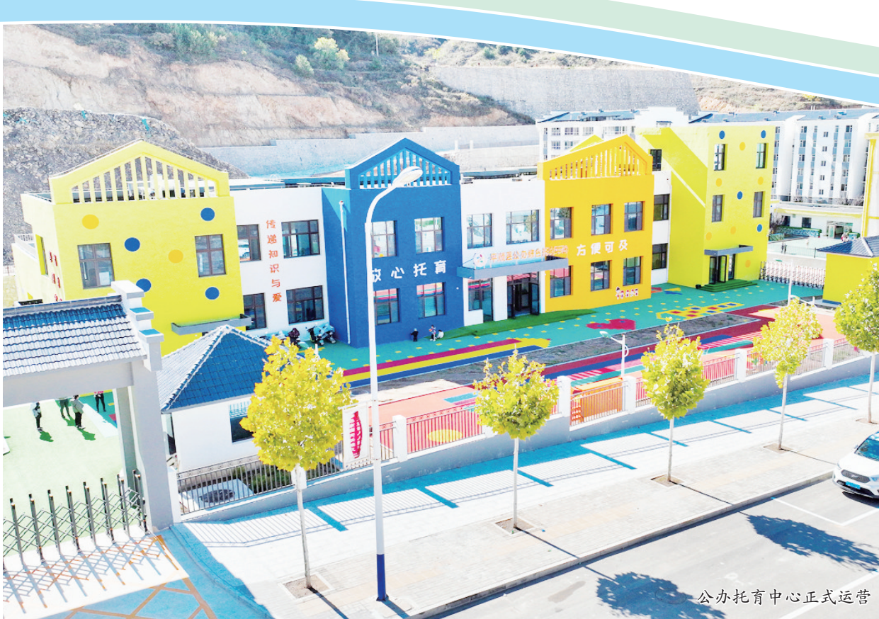
公办托育中心正式运营