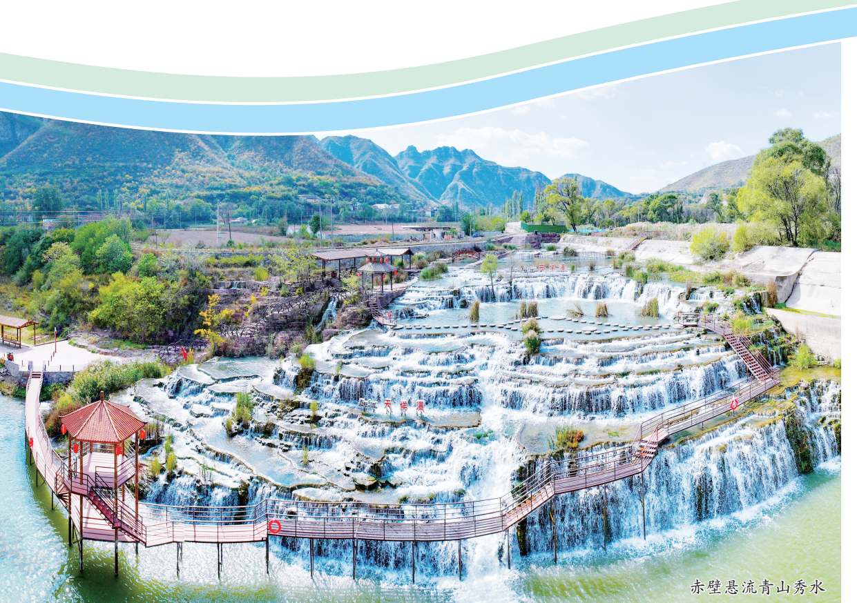
赤壁悬流青山秀水