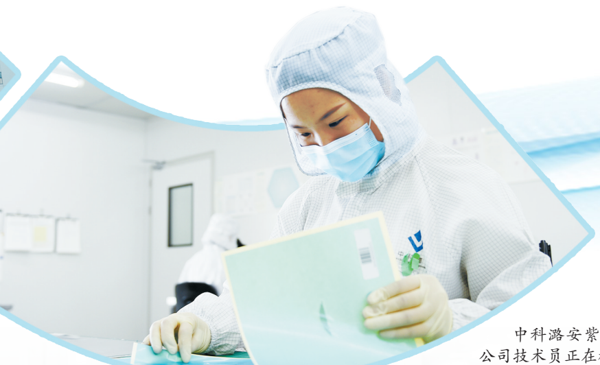
中科瑞安紫外光电科技有限公司技术人员正在检测芯片性能