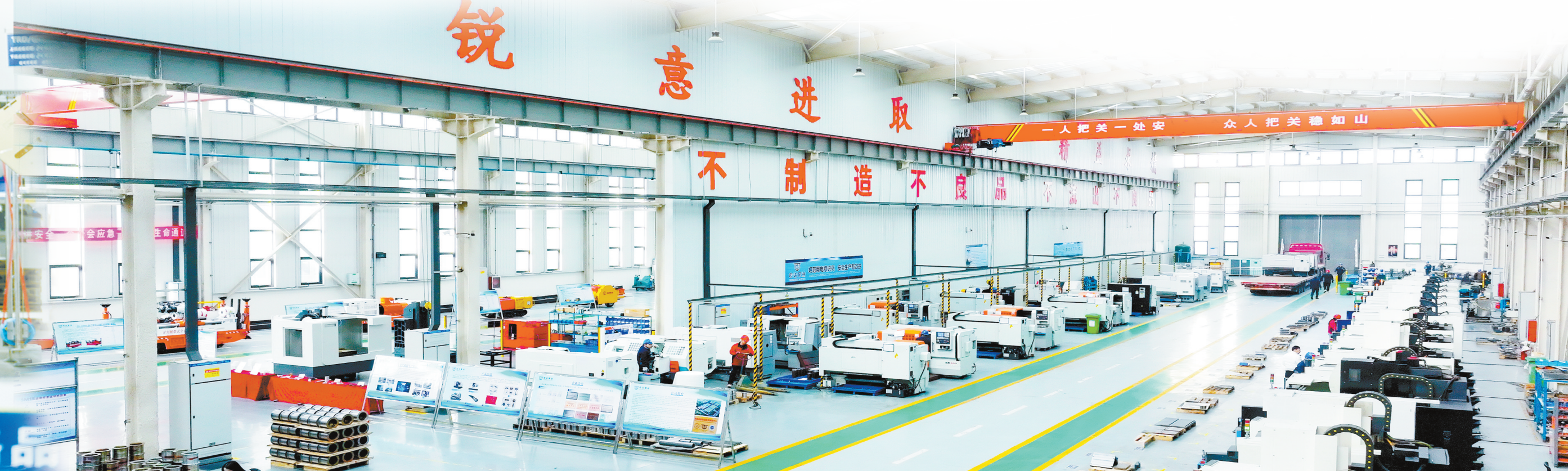
宏达聚益机械股份有限公司生产车间一片繁忙景象