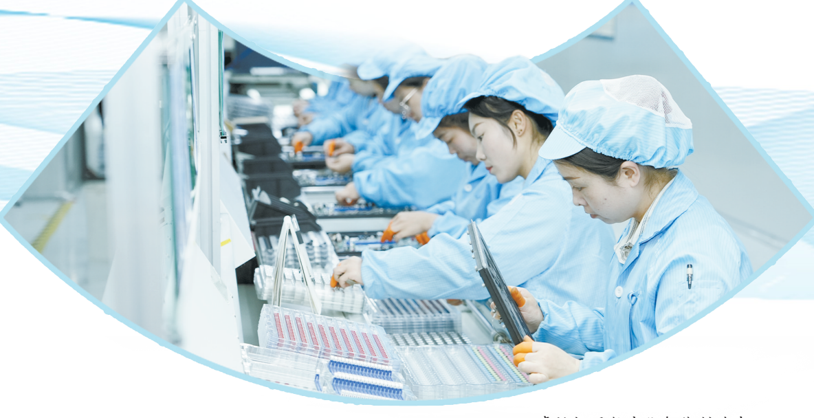
卓怡恒通数字化智能制造车间，员工们正在组装笔记本电脑

策划/宋玉红 统筹/陶晓虎 文字/常珍珍 设计/李宇轩