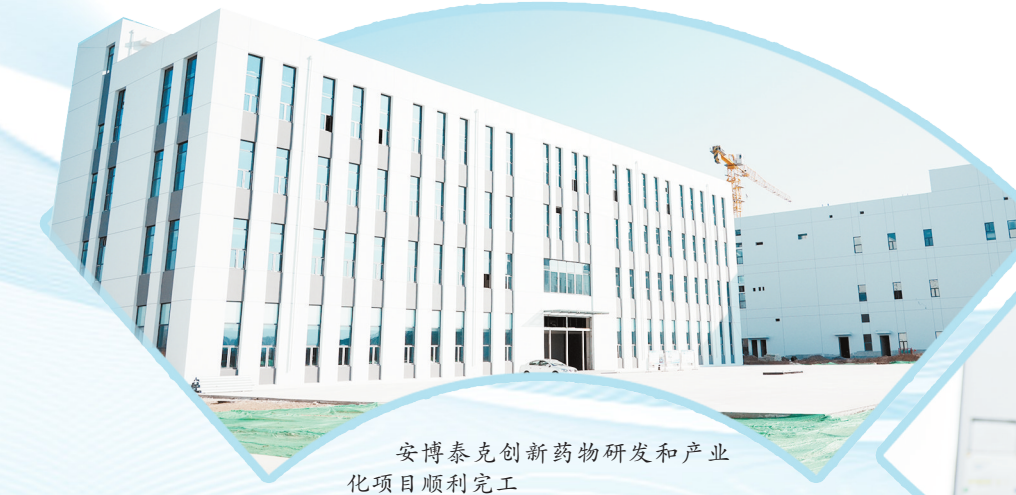
安博泰克创新药物研发和产业化项目顺利开工

风从东方来。年产4万吨锂离子动力电池负极材料一体化项目加速建设，填补长治高新区动力电池材料产业领域空白；安博泰克药业有限公司创新药物研发和产业化项目落地开花，对长治做大做强生物医药和大健康产业具有重要意义；…… 乘风而上。一批批产业转移项目从东部发达地区迁徙到此，在长治高新区开花结果，焕发勃勃生机。御风而行。依托区位优势，围绕发展定位，瞄准主攻方向，长治高新区全力推动承接东部产业转移示范区、北京对口合作示范区“两大示范区”建设向纵深推进，为高质量发展提供坚实支撑。 吹响“集结号”，抓项目谋利储备，积蓄发展后劲—— 发挥比较优势，锚定东部产业转移储备项目。针对东部企业要素趋紧、成本趋高现状，长治高新区深入挖潜用工、用地、用能等方面优势，出台涵盖土地使用、厂房租赁、设备补贴、人才引进等“一揽子”招商政策，明确产业方向。 围绕主导产业集聚发展，2024年，长治高新区铺开重点项目68个，总投资422亿元。其中列入省重点工程项目10个，总投资1571亿元。其中正极材料、负极材料等产业类项目达45个，总投资551亿元。 夯实“压舱石”，抓项目高效推进，厚植发展优势—— 围绕重点项目集群成势，成立工作专班，靠前服务、一线帮扶，主动为项目排忧解难。 新能源产业集群，重点推进年产10万吨磷酸铁锂正极材料项目、年产4万吨锂离子动力电池负极材料一体化项目。项目建成投产，将形成正负极一体化锂电池新材料产业格局。 装备制造产业集群，智能高端装备制造产业项目一期建成投产，同时开工建设二期、三期、四期工程。山西宏达聚益机械股份有限公司、钜星锻压机械股份有限公司等制造企业已入驻。山西宏达聚益机械股份有限公司实施的金属表面处理产业园项目正在加快推进，有效填补长治数控机床产业空白。 生物医药与大健康产业，安博泰克药业有限公司创新药物研发和产业化项目一期加快推进。光益生无创光疗设备产业化项目建成投产，致力于打造“光医疗之都”。 电子信息产业集群，电子高端材料、华耀亿嘉集成电路有限公司集成电路、康运达控股(山西)有限公司智能锁等10余个电子信息产业项目建成投产，实现“小升规”，形成发展新支撑。 挖掘项目“富矿”，打造发展引擎。勇当高质量发展排头兵，长治高新区主动作为、大胆突破，让发展优势更大、发展动力更足。