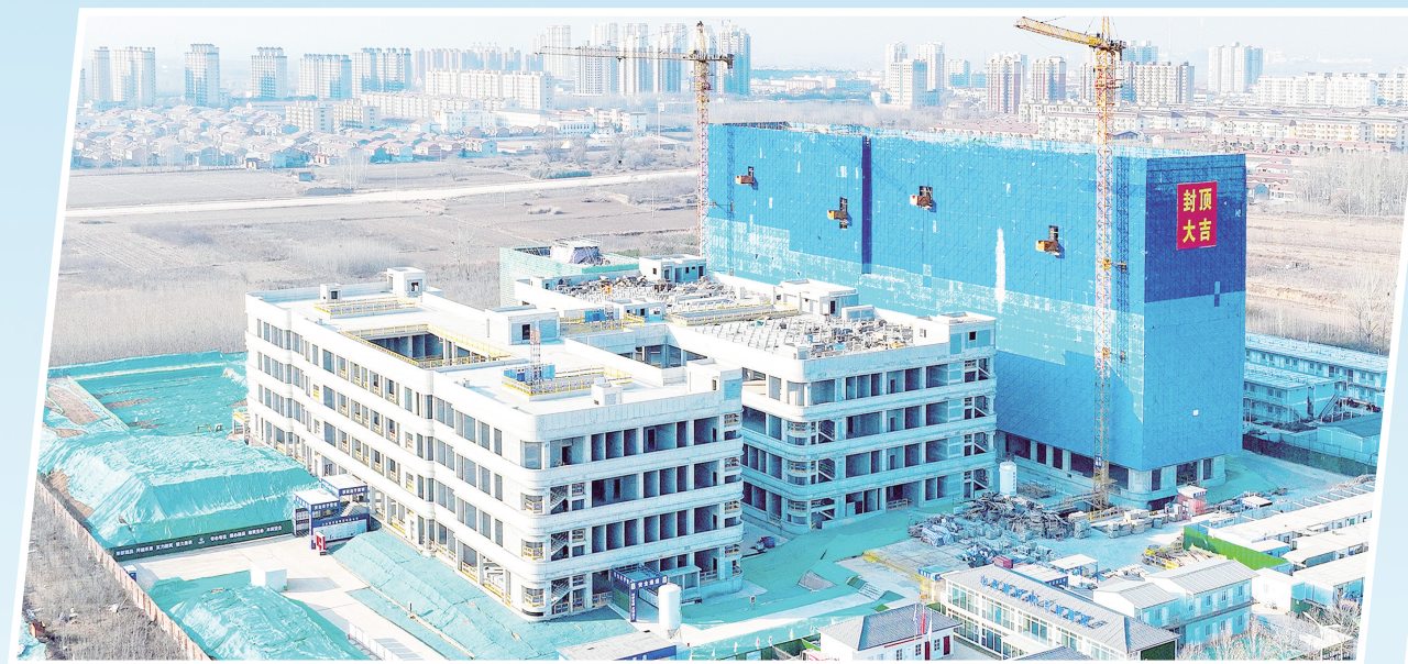
人民医院建设项目改善医疗环境