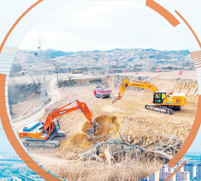
远望能源102MW风电项目开工建设