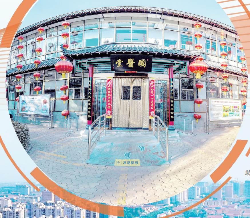
京长对口合作项目国医堂助力中医药创新发展