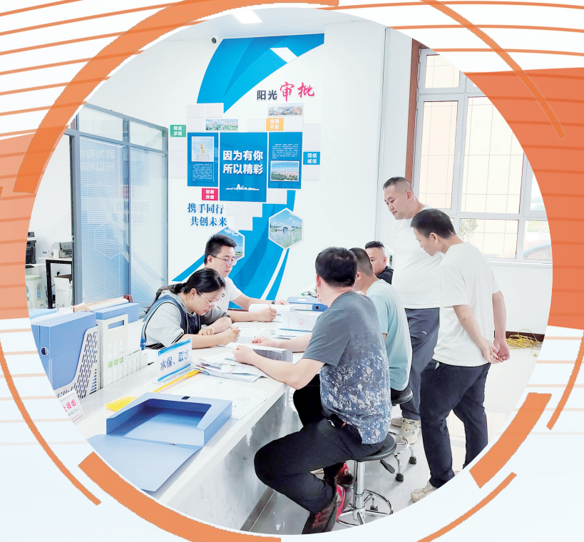
“一站式”政务服务便民利企提效能