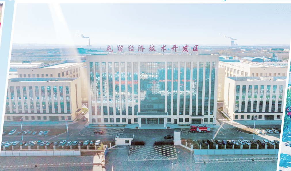
标准化厂房助力企业“投资上市”