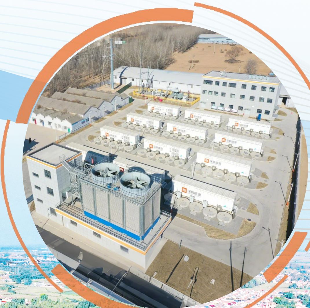
30MW飞轮储能项目并网发电

营商环境的好转，是保证快速发展的重要基础。屯留区在创优营商环境中持续开展营商环境创新提升行动，完善政务服务“高效办成一件事”机制，提高群众办事便利度和满意度；同时加快推动“7×24小时”政务服务便民站全覆盖，深化部门联合“双随机、一公开”监管，营造诚实守信市场环境；积极培育经营主体，及时兑现各项优惠政策，推动“个转企、小升规、规改股、股上市”，培育“小升规”企业5家、股份制改造两家。在政策落实过程中，屯留区坚决消除“梗阻”现象，为企业、经营主体提供高效优质服务，严格规范企业公事务活动，实行人企服务备案制度，做到无事不扰、有需必应，让广大企业家在屯留大有可为、大有作为。