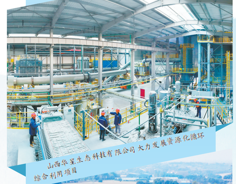
山西华星生态科技有限公司大力发展资源化综合利用项目