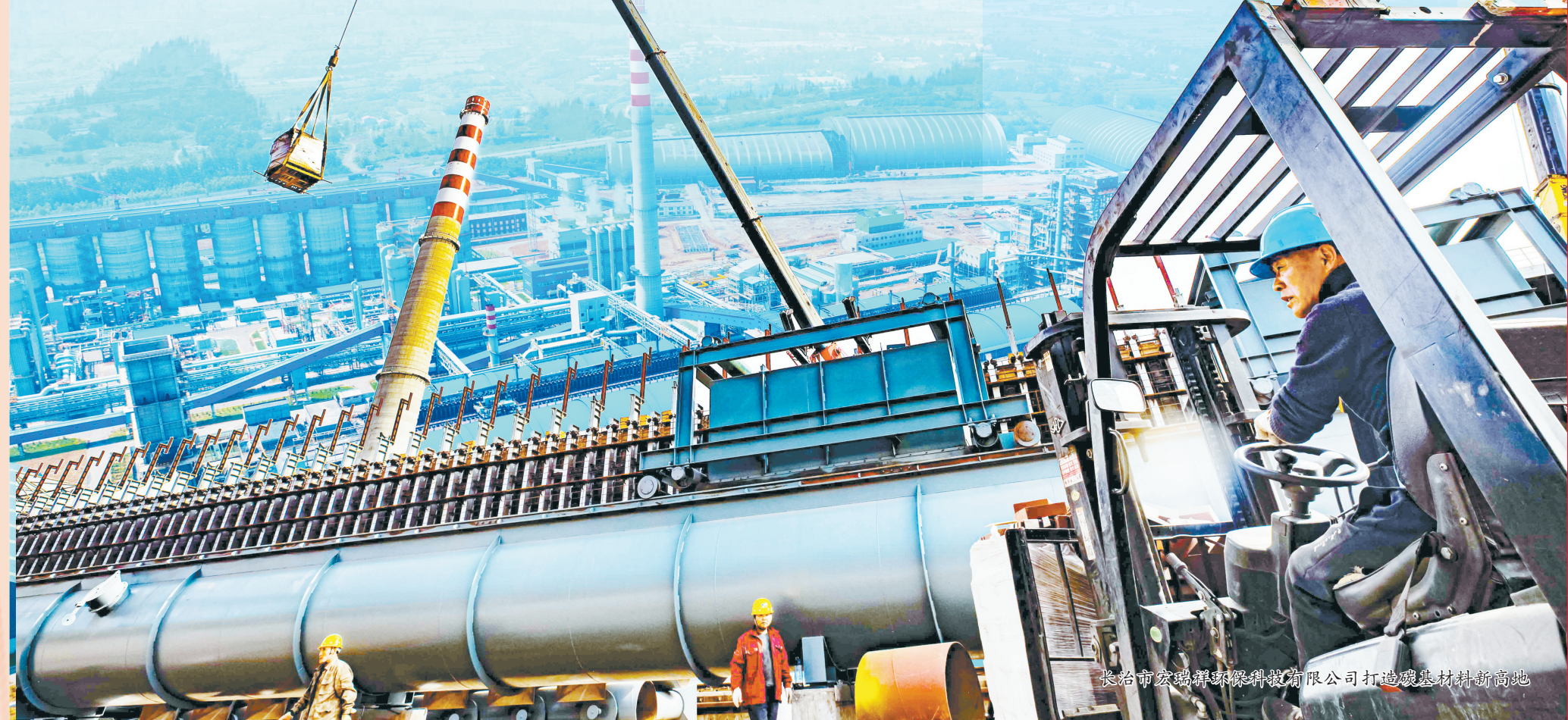
长治市宏瑞环保科技有限公司打造碳基材料新高地