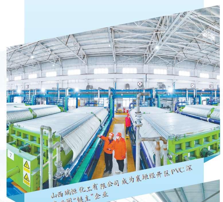
山西瑞恒化工有限公司成为襄垣经开区PVC深加工产业园“链主”企业

随着一个又一个重点项目由“蓝图”化为“施工图”,再从“施工图”变为“实景图”,一浪高过一浪的项目建设热潮不断在这片充满生机的土地上涌动。襄垣县将深入践行“四个抓落实”重要要求,用足“四全”纾困的“加法”、行政审批的“减法”、服务保障的“乘法”、要素制约的“除法”,以项目建设的“速度”和“热度”,书写高质量发展高分答卷,推动“十四五”圆满收官,为“十五五”良好开局奠定坚实基础,奋力谱写中国式现代化襄垣篇章。