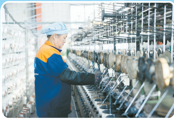
山力铂纳橡胶机带有限公司以科技赋能,积极打造煤机装备“新高地”