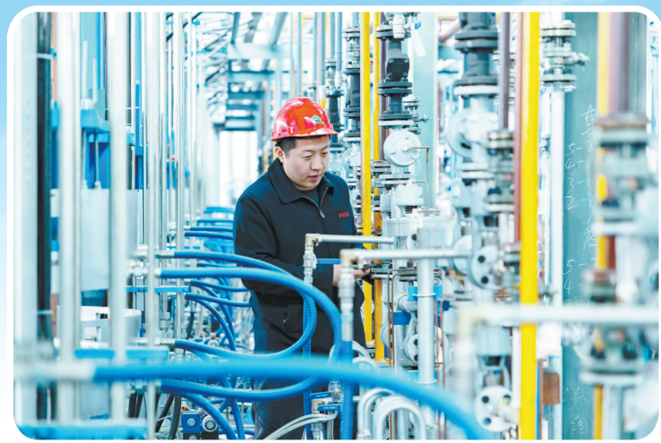
山西酷纳斯通橡胶科技有限公司年产1000万条子午线轮胎项目加紧建设