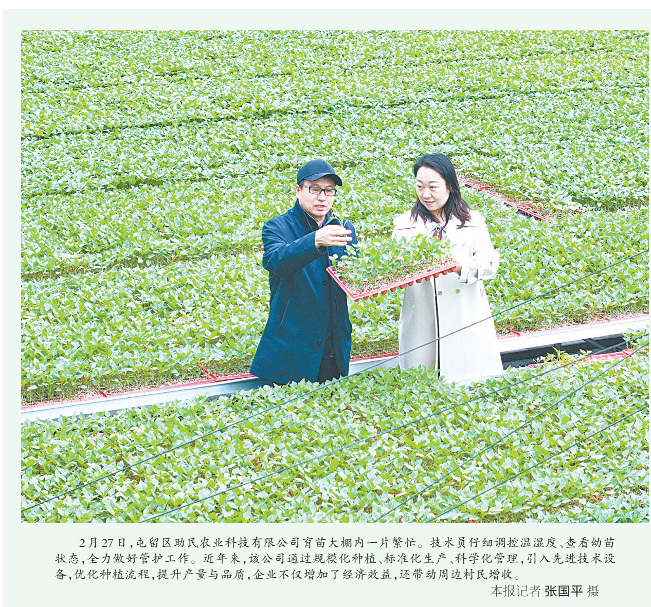
2月27日,屯留区助民农业科技有限公司育苗大棚内一片繁忙。技术员仔细调控温湿度、查看幼苗状态,全力做好管护工作。近年来,该公司通过规模化种植、标准化生产、科学化管理,引入先进技术设备,优化种植流程,提升产量与品质,企业不仅增加了经济效益,还带动周边村民增收。