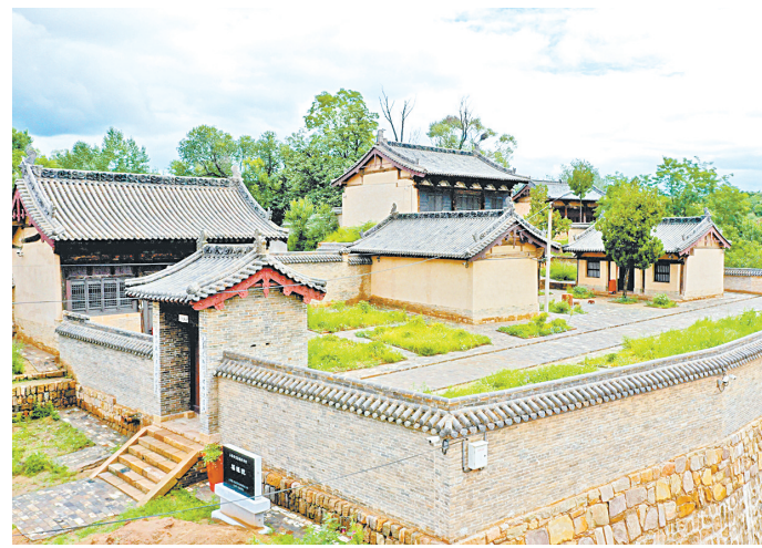
福源院兼具多个朝代建筑特色。