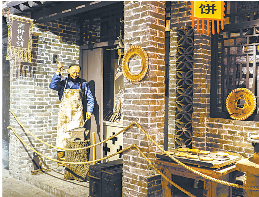
一家家商铺讲述着襄垣南北老街的故事。

为更好地保护和传承地方历史文化、民俗文化，襄垣县积极筹建老物件博物馆，并于2019年正式开馆。该馆以“留存民