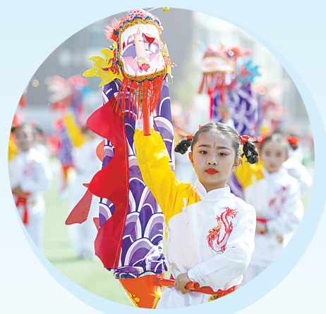
丰富多彩的校园文化艺术节,促进学生全面发展。

“努力让每个孩子都能享有公平而有质量的教育。”——这是坚持以人民为中心发展教育的庄严承诺。 “走好改革创新路,探索教育发展新路径。”——这是襄垣县推动教育高质量发展的必由之路。 2024年以来,襄垣县坚持把教育摆在优先发展的战略地位,全面落实立德树人根本任务,高点谋划、高位推进,持续强化投入,全面深化改革,提高教学质量,全力办好人民满意的教育。 重点工程持续开展,京长对口合作成果丰硕、教学质量稳步提升、“放心午餐”全面覆盖……一系列深化教育改革的亮眼措施,是襄垣县委、县政府尊师重教的生动注脚,为该县教育高质量发展注入强大动力。