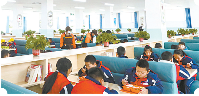
“放心午餐”工程,让孩子吃到营养均衡的午餐。