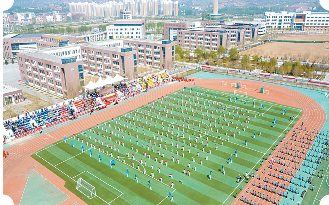
建设现代化操场,提升学生体育学习体验。