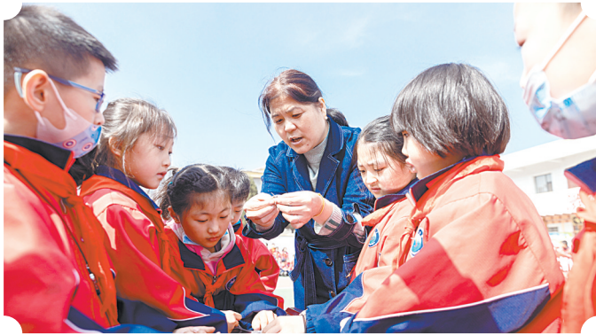
充分利用社团师资优势,开展丰富多彩的户外活动。