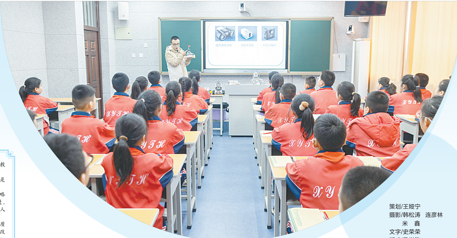
开设机器人社团特色课程,让学生零距离感受科技魅力。

“努力让每个孩子都能享有公平而有质量的教育。”——这是坚持以人民为中心发展教育的庄严承诺。 “走好改革创新路,探索教育发展新路径。”——这是襄垣县推动教育高质量发展的必由之路。 2024年以来,襄垣县坚持把教育摆在优先发展的战略地位,全面落实立德树人根本任务,高点谋划、高位推进,持续强化投入,全面深化改革,提高教学质量,全力办好人民满意的教育。 重点工程持续开展,京长对口合作成果丰硕、教学质量稳步提升、“放心午餐”全面覆盖……一系列深化教育改革的亮眼措施,是襄垣县委、县政府尊师重教的生动注脚,为该县教育高质量发展注入强大动力。