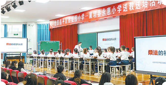
北京昌平区昌盛园小学在襄垣县永惠小学开展送教送培活动。

近年来,襄垣县牢固树立抓教育就是抓发展的理念,千方百计增加教育投入,全力以赴推进项目建设。当前,滨河小学项目稳步推进,已完成总工程量三分之一;同步谋划滨河初级中学项目、一中高中部扩建项目;实施襄垣一中电网改造项目、县城县直中小学健康教室改造项目,更新中小学实验仪器、照明等配套设施。此外,新建西营镇中心幼儿园、襄垣一中两栋公寓楼改造项目及迎宾幼儿园改造扩建项目全面完工。这些教育新地标实现了让孩子们从“有学上”到“上好学”的跨越式发展。