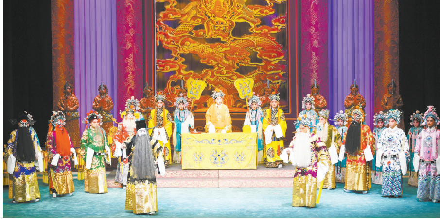
市豫剧团演出的《宇宙锋》荣获第十八届山西省“杏花奖”新剧目奖。

好作品背后，是不断的打磨创新。《宇宙锋》完整保留陈派“修本”“装疯”“金殿”流派艺术精华的同时，在追求叙事完整性上下功夫，整合《一口剑》《六义图》等相关情节讲清故事来龙去脉，守流派之“正”，