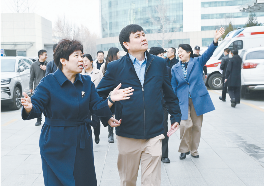
专家一行参观市人民医院各项设施,了解学科建设情况。

40多年来,该科室业务技术不断提升,在多次传染病流行的重要时期奋战在一线,为本地区传染病防治起到了非常重要的作用。截至目前,该科室已构建艾滋病创新技术中心、乙肝/丙肝临床治