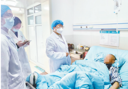
日常查房详细了解患者病情。