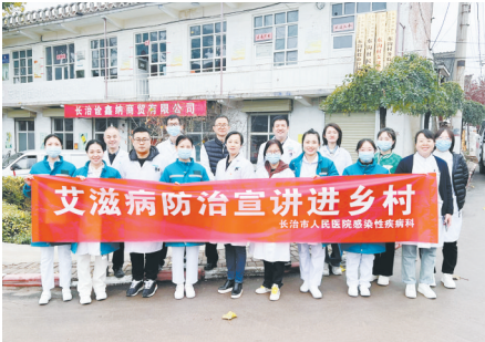
定期下乡宣传传染性疾病预防知识。