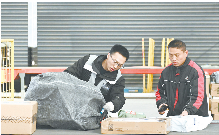
12月6日,长子县轩阳综合物流园区的快递分拣中心,工作人员在对快件进行验视、分拣。近年来,该园区围绕物流产业链和生态服务功能建设,规划城市配送中心、现代仓储中心、信息交流中心等八大中心打造物流全产业链,形成有机物流生态圈。目前已有物流、电商、科技农业、装备制造等30余家企业入驻园区。

据悉,黎城县冬灌工作自11月下旬启动,计划灌溉用水量达780万立方米,覆盖6万余亩农田,预计于12月10日前全部完成。