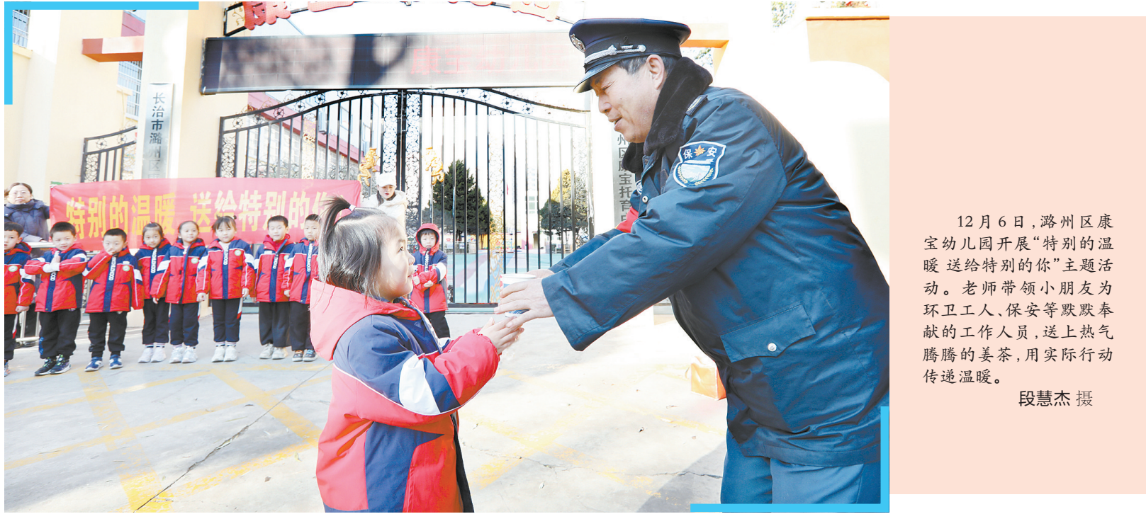
12月6日,潞州区康宝幼儿园开展“特别的温暖 送给特别的你”主题活动。老师带领小朋友为环卫工人、保安等默默奉献的工作人员,送上热气腾腾的姜茶,用实际行动传递温暖。

今年9月,自来水管网改造升级后,他家里“啥时候都有水,洗衣做饭浇菜很方便”。这是城乡供水一体化工程,为老百姓