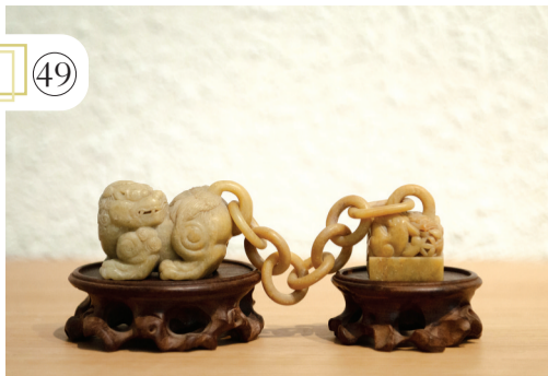
雕刻作品(寿山老岭石瑞兽链环摆件)