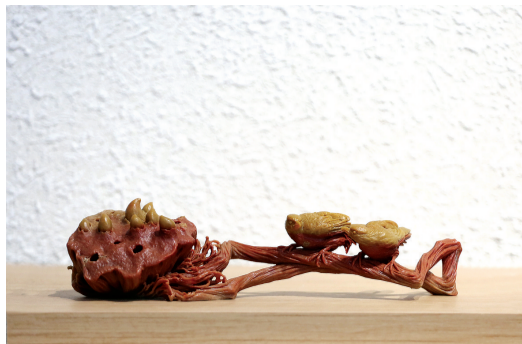
雕刻作品(寿山高山石喜事连连摆件)