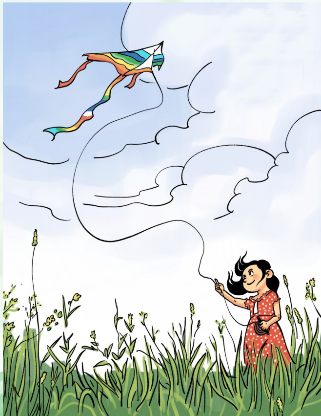
放风筝好心情 新华社发 德德德 作

眼前,春风吹暖大地,在广阔的乡野间,那漫山的花儿正陆陆续续成群结队的相伴而来,让我们打开大门、敞开心扉,赶紧迎接这声色喧闹的姹紫嫣红吧!