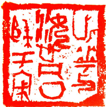
此花与汝心同归于寂