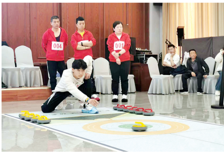
运动员们瞄准赛道圆心处,单手发力掷壶。

据了解,本次比赛为期3天,共设轮椅组、听力组、智力组3个组别,旨在丰富和活跃残疾人精神文化体育生活,展现残疾人积极向上、自强不息的良好精神风貌,加快推广残疾人大众冰雪运动,大力推动残疾人康复健身体育运动发展。