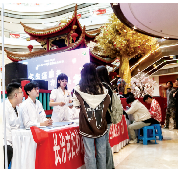
医护人员为群众讲解孤独症相关知识。