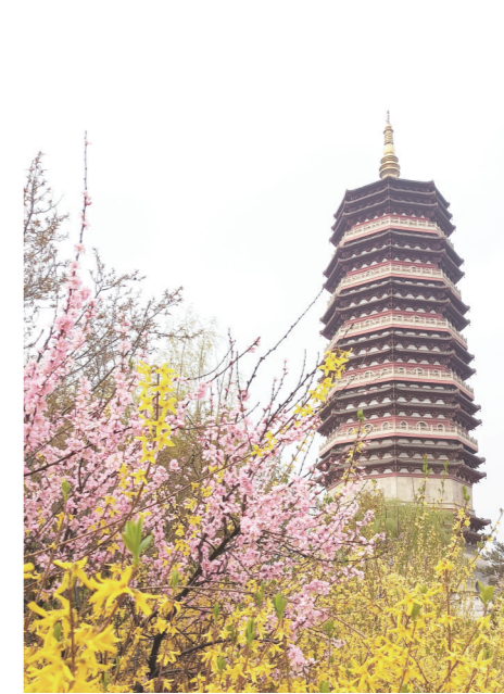
各色春花相继开放。