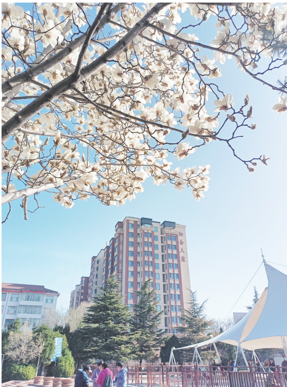
玉兰花迎来盛花期。