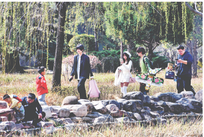
市民三五成群或携家带口在公园里游玩。