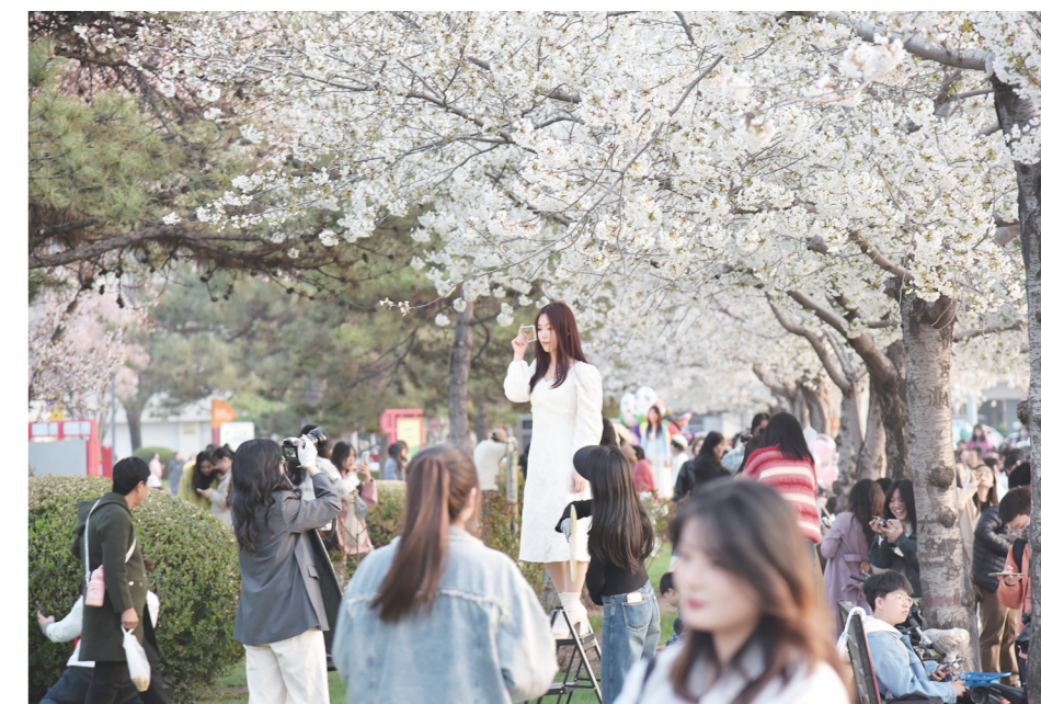
市民徜徉花海,或打卡拍照,或现场直播。