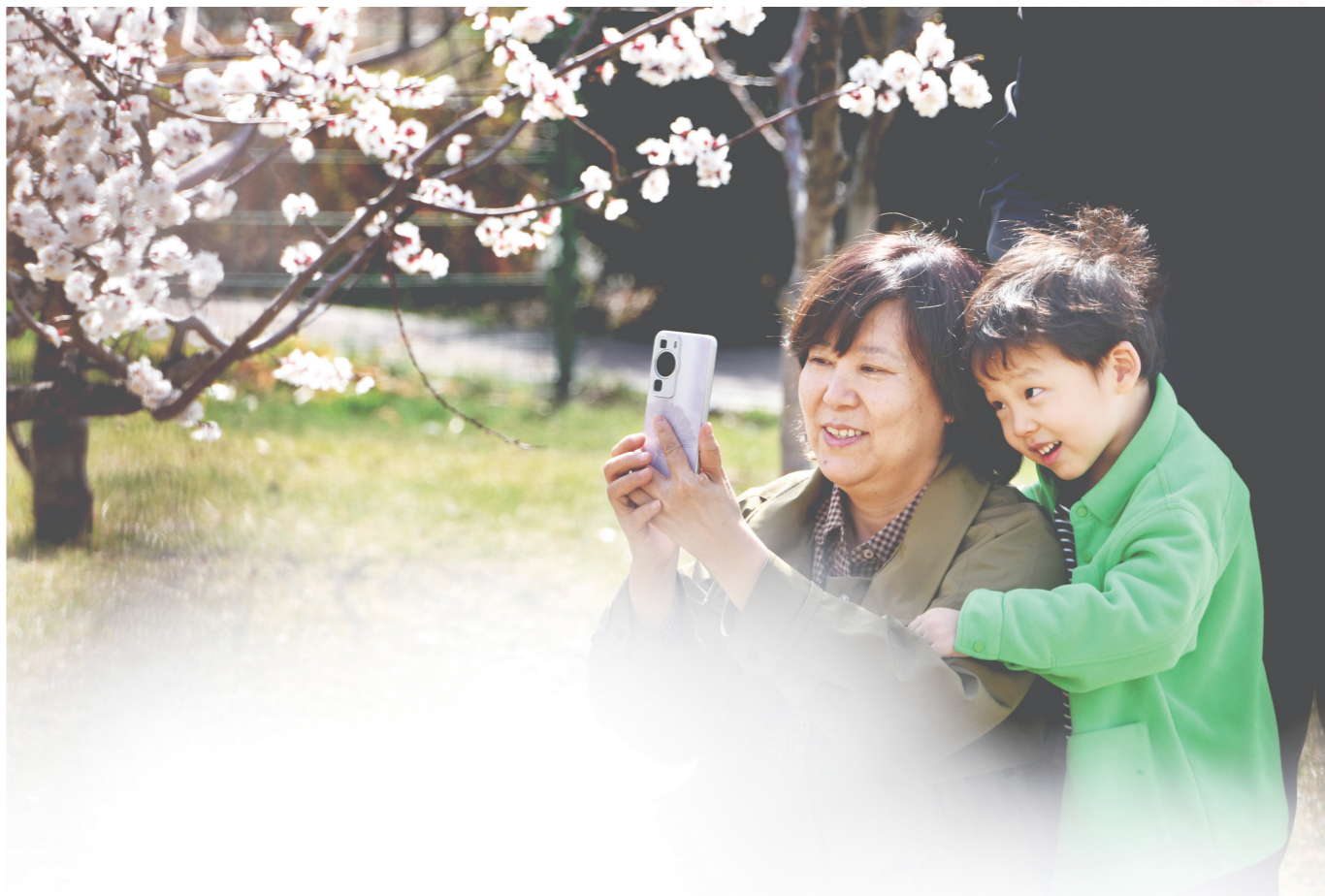
打卡拍照,记录美好瞬间。

连日来,在六府塔公园里,连片杏花已竞相开放,杏林花海,美不胜收。进入四月,主城区紫叶李、碧桃、美人梅、西府海棠、丁香等将竞相开放,市民可以趁着晴好天气踏青赏花,在亲近大自然中乐享美好春光。