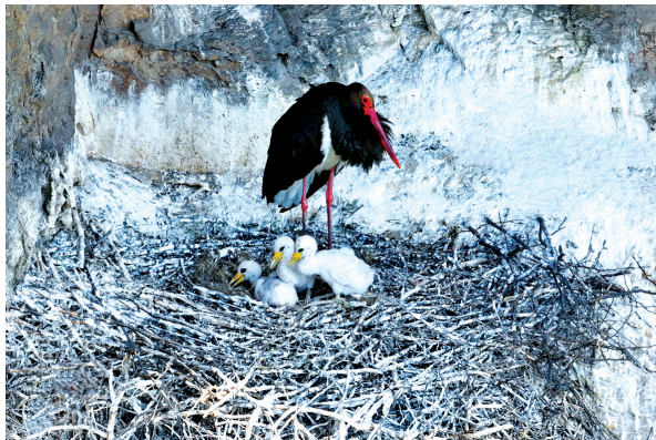
黑鹳 国家一级保护动物。(2023年5月摄于黎城县)

让我们共同守护长治这片生态天堂,让八百里浊漳成为候鸟永远的家园。在人与自然和谐共进的道路上,携手前行,为子孙后代创造更美好的世界。让我们珍惜这难得的和谐,与鸟类共同谱写美丽的生态乐章!