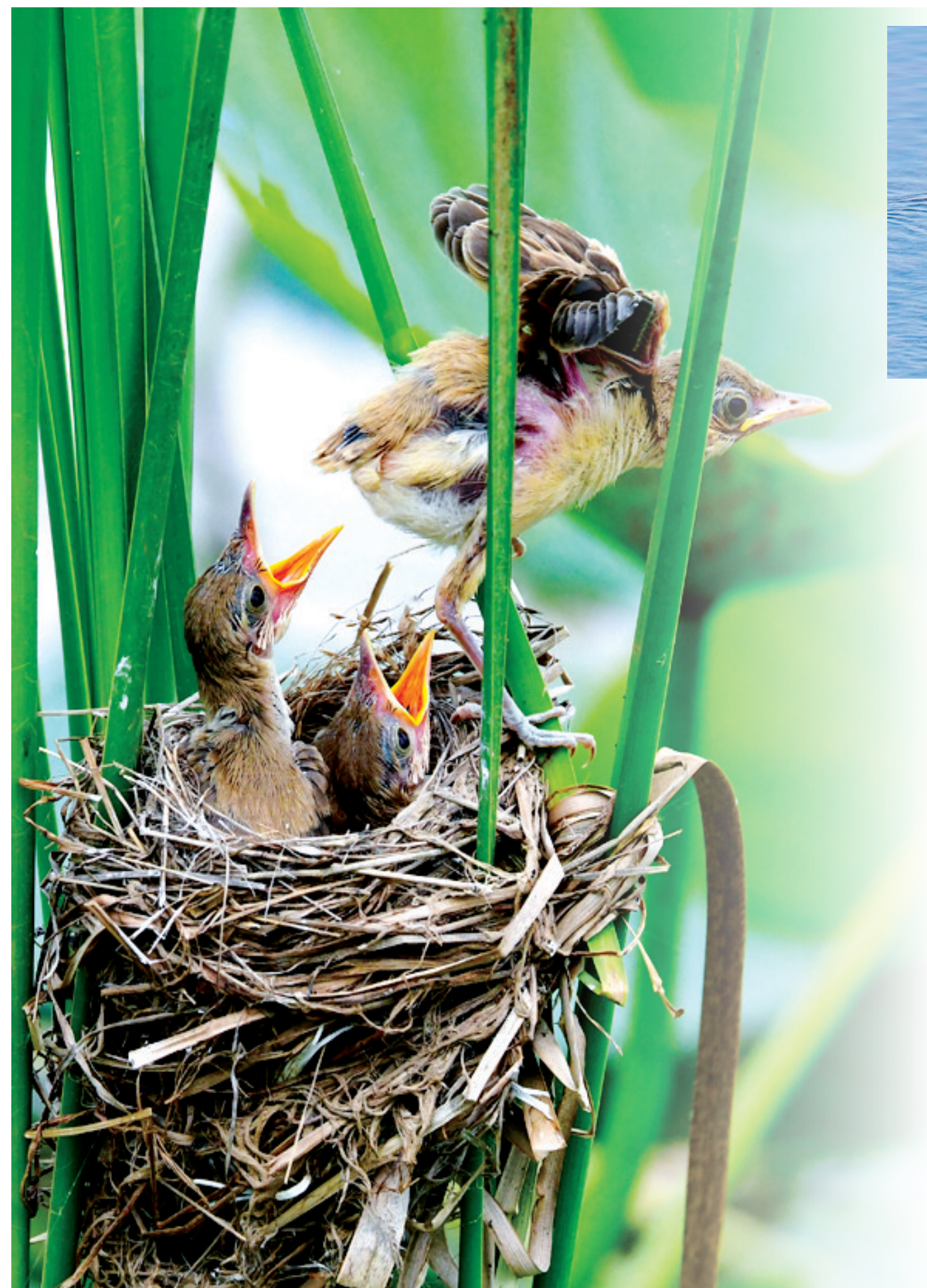
大苇莺 国家三有保护动物。(2023年6月摄于屯留区)