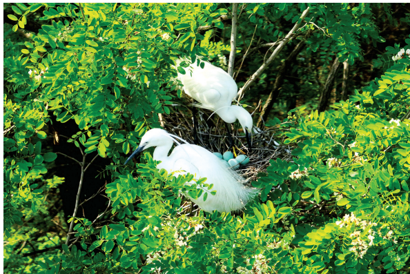
白鹭 国家三有保护动物。(2023年7月摄于襄垣县)