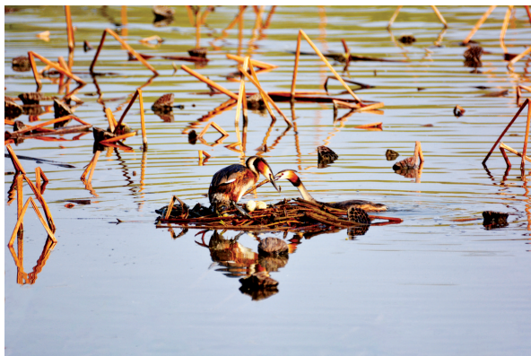
凤头鸊鷉 国家三有保护动物。(2023年4月摄于沁县)