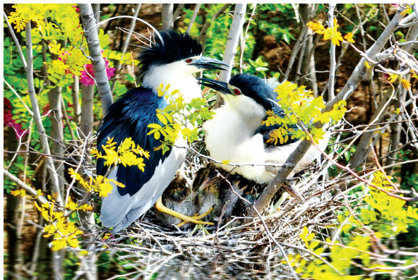
夜鹭 国家三有保护动物。(2023年7月摄于襄垣县)