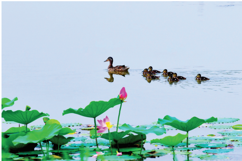
绿头鸭 国家三有保护动物。(2023年6月摄于潞州区)