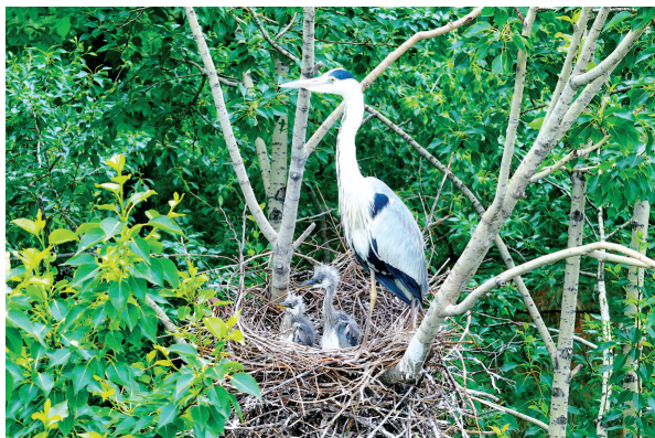
苍鹭 国家三有保护动物。(2023年5月摄于沁源县)