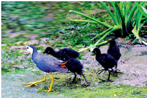
白胸苦恶鸟 国家三有保护动物。(2023年6月摄于长子县)