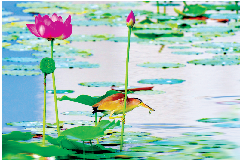
黄苇鳉 国家三有保护动物。(2023年7月摄于上党区)