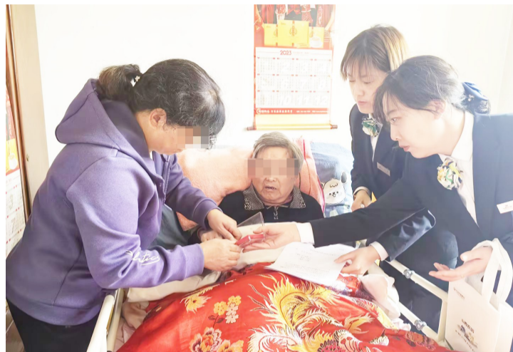
工作人员仔细为老人核对信息。

近年来，该行始终秉承“以客户为中心”的服务理念，通过不断创新和完善服务方式，将优质服务与人文关怀融为一体，为广大客户提供更加贴心、周到的金融服务。