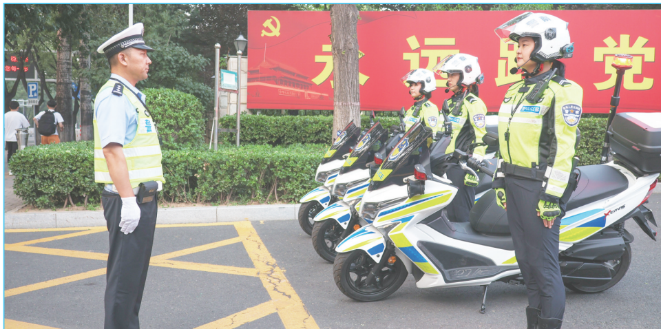
女子铁骑中队整装待发。