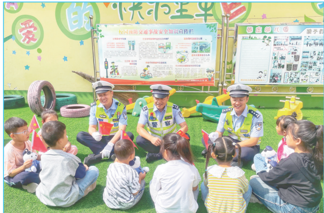
民警给小朋友们宣传讲解交通安全知识。