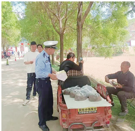
平顺交警向群众讲解交通安全知识。

本报讯 5月19日,平顺交警以“法润平安 文明相伴”为主题,深入北社乡开展“美丽乡村行”交通安全巡回宣讲活动。以来做好农村道路交通安全宣传工作,提高农村群众守法意识,