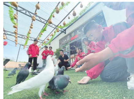
石泉海田园艺术庄园内丰富的研学体验。