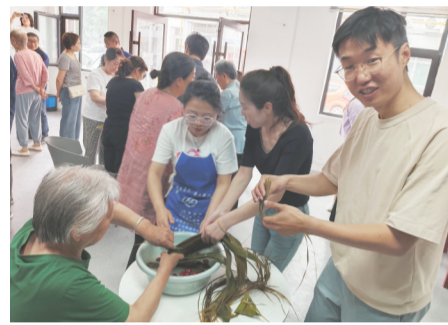
5月29日,潞州区太西街道太西社区与国昌置业联合开展了“共建共联一家亲粽叶飘香端午情”端午节包粽子活动。

市民政局负责人表示,通过此次考察调研,我市各级民政部门进一步明确了完善养老服务体系的重要意义,并将借鉴和推广居家养老服务新模式、发展多样化养老助餐服务、提升医养结合服务,更好满足老年人多层次、多样化、个性化的养老服务需求,不断增强老年人的获得感、幸福感、安全感,实现老有所养、老有所依、老有所乐。