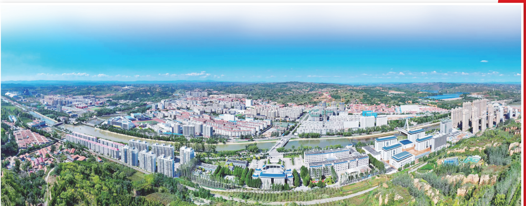
武乡新貌。

“武乡既是外公、外婆工作战斗的地方，也是母亲出生地。与武乡的情感是发自骨子里的。我们将师子女第三代、第四代已经接过父辈手中的旗帜，多次回到武乡接受传统教育，传承红色基因。武乡人民对八路军有情，对我们有恩，武乡是我们心目中永远的家！”左权将军的外孙、八路军研究会副会长、八路军研究会青年分会会长沙峰满怀深情道出知心话。